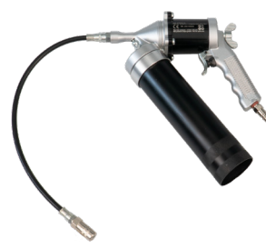
B-MATIC 53/400 Ghiera+tubo per cartucce tipo LShuttle filettate da 400 gr.