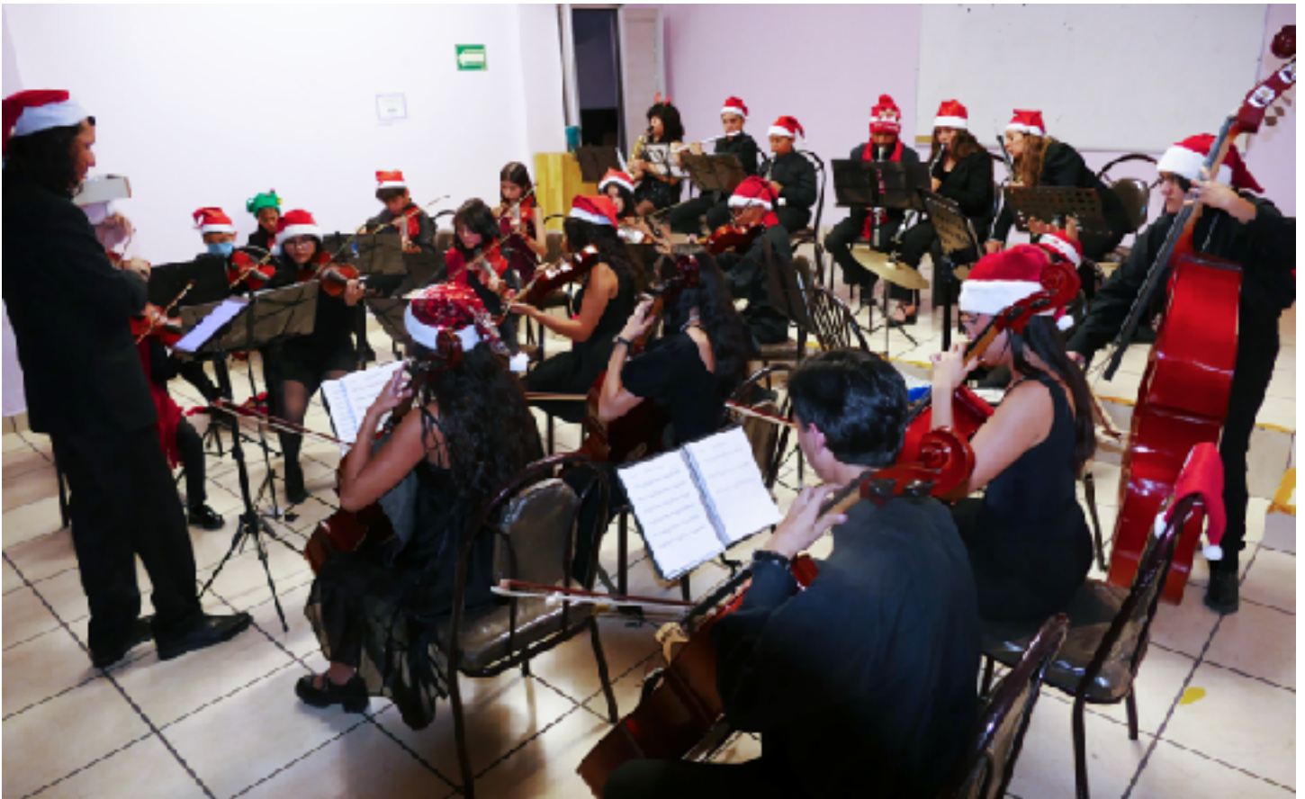
16 de diciembre Orfanatorio “Magdalena Sofía”.