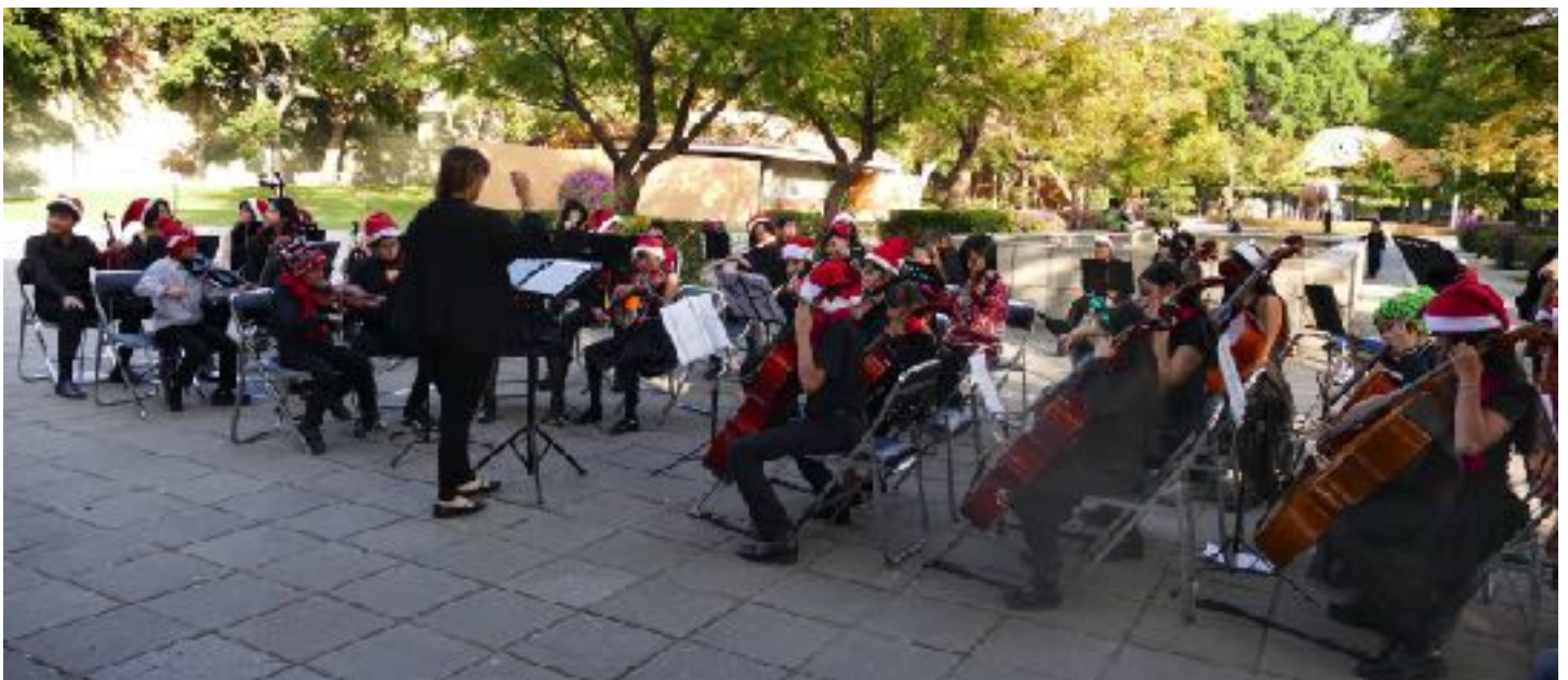
18 de diciembre en el Zoológico Guadalajara en la posada para alumnos y padres de familia