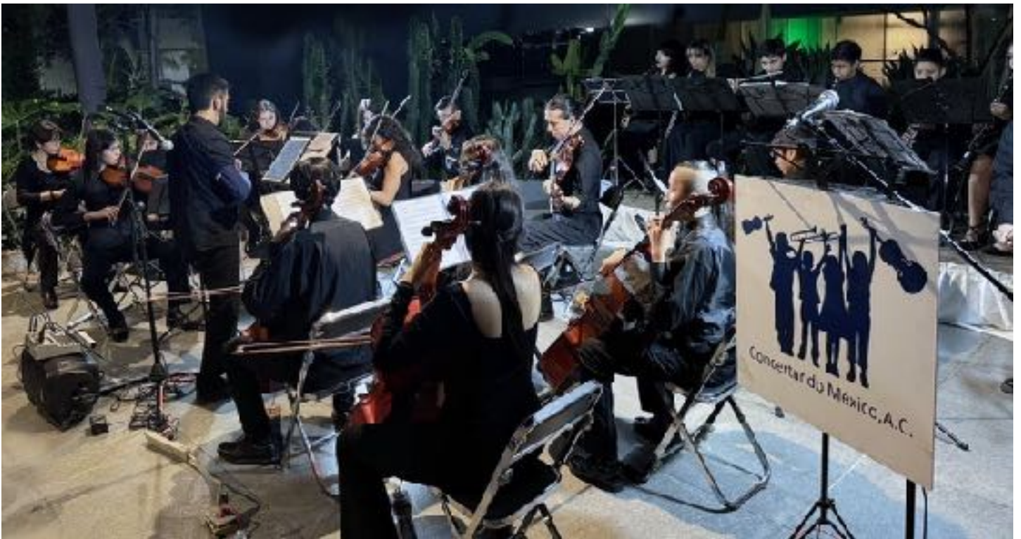
23 de octubre Concierto de Otoño 2025 de Concertando México en el GWTC.