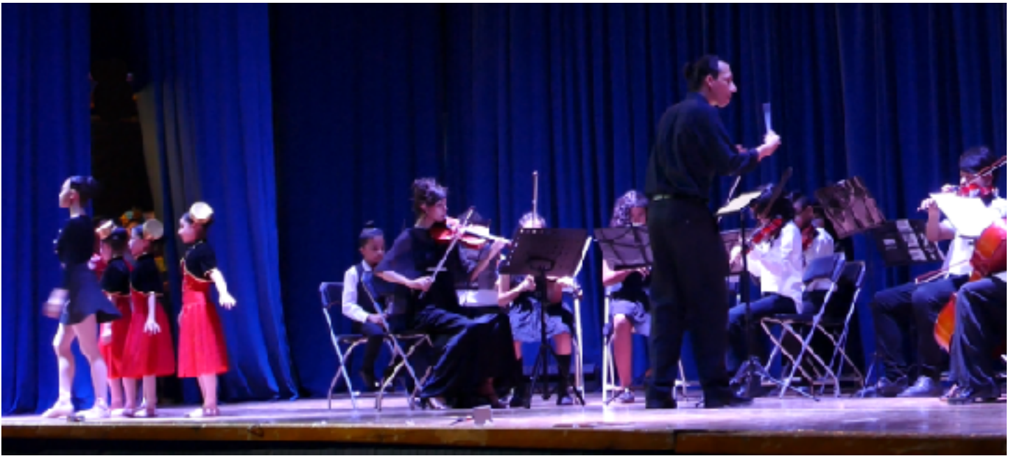
6 de julio Gala de Ballet, Foro Aulex.