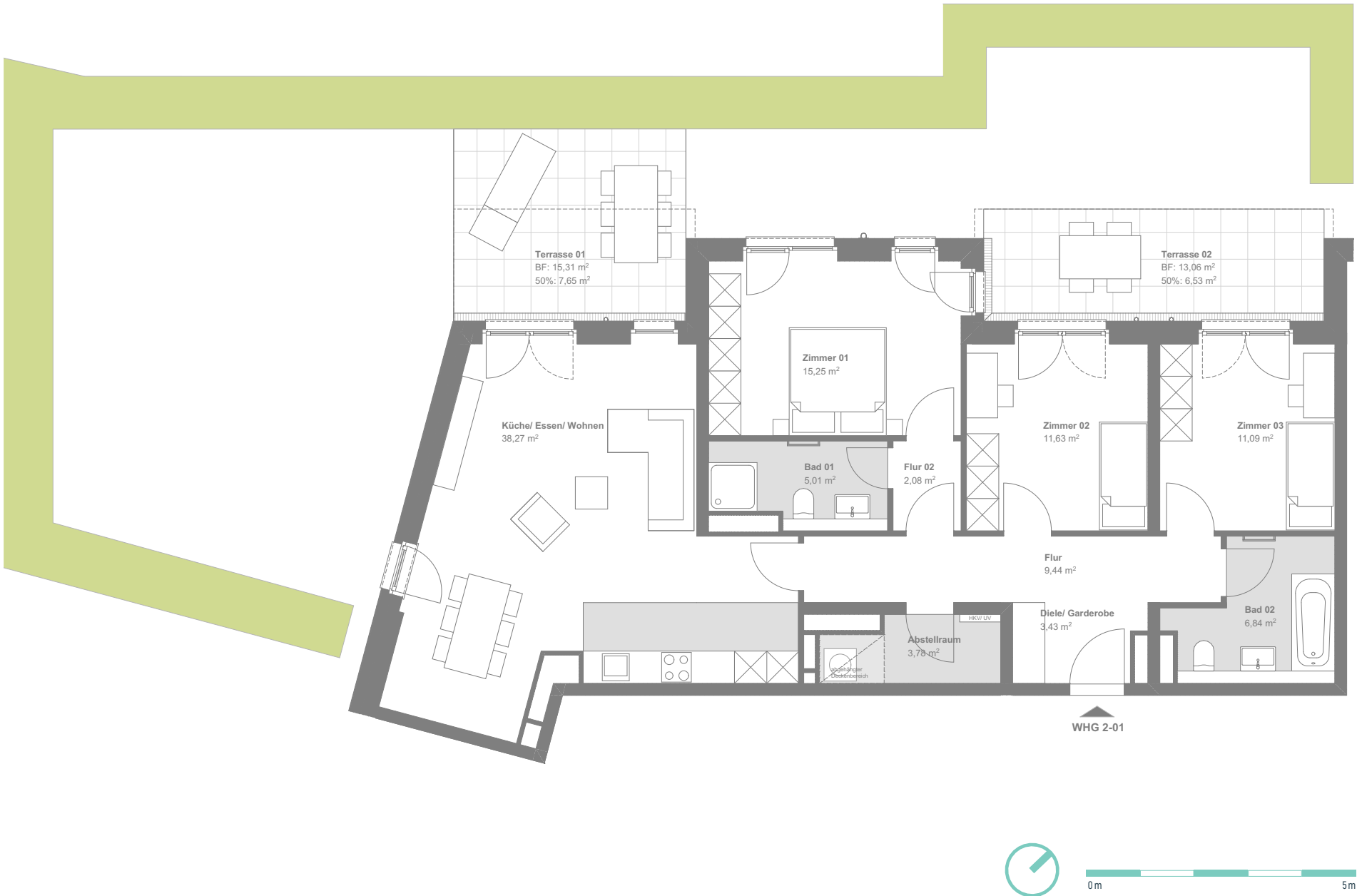
Lage im Quartier