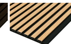
Eiche rustikal WP foliert