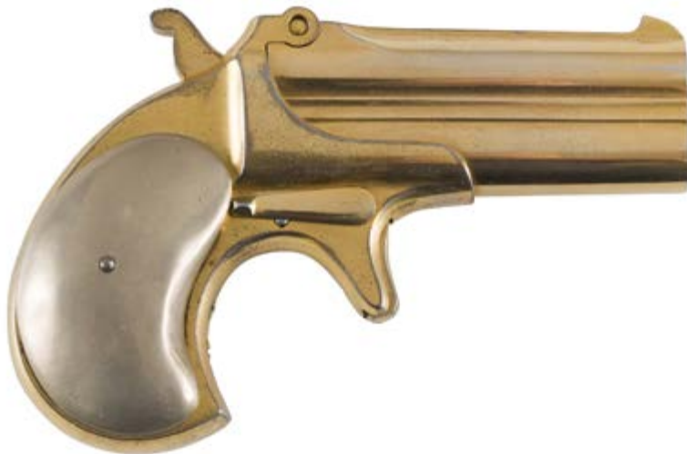
273 PISTOLET REMINGTON OVER UNDER MODÈLE N°3, DEUX COUPS, CALIBRE 41 ANNULAIRE. Canons ronds superposés avec signature sur la bande. Détente éperon. Plaquettes de crosse en argent. Finition dorée. T.B.E. Vers 1890-1900. 1 000 / 1 500 €