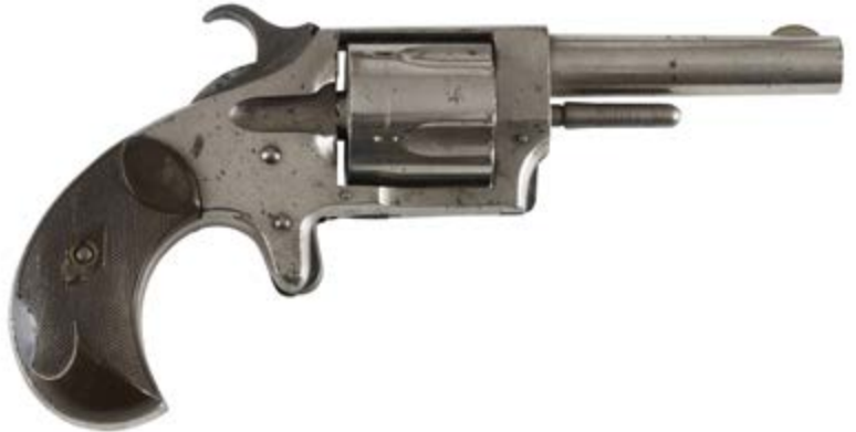
272 REVOLVER U.S. STERLING, CINQ COUPS, CALIBRE 32 ANNULAIRE. Canon rond. Barillet évidé. Carcasse fermée avec marquage. Détente éperon. Baguette en fer. Crosse en ébonite quadrillée. B.E. Finition poli glacé. Vers 1880. 200 / 300 €