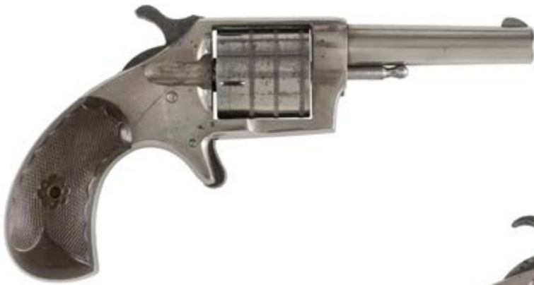
271 REVOLVER U.S. CONTINENTAL, CINQ COUPS, CALIBRE 32 À PERCUSSION ANNULAIRE. Canon rond avec marquages. Barillet strié. Carcasse fermée. Détente éperon. Plaquettes de crosse en bois quadrillées (une réparée). B.E. Vers 1880. Finition poli glacé. 200 / 300 €