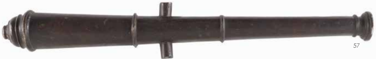
57 FÛT DE CANON DE FÊTE. En bronze patiné à quatre anneaux de renfort, et deux tourillons. Calibre: 22 mm Longueur: 68 cm A.B.E. XIX e siècle. 200/300€