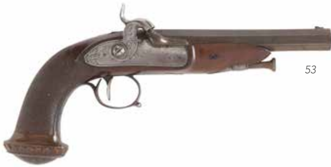
53 PISTOLET À PERCUSSION D'OFFICIER. Canon à pans rebronzé et poinçonné de Liège. Platine et chien à corps plat. Garnitures en fer gravé. Crosse en noyer sculpté et quadrillé. Baguette en fer. Longueur: 29 cm A.B.E. Vers 1830. 200/300€