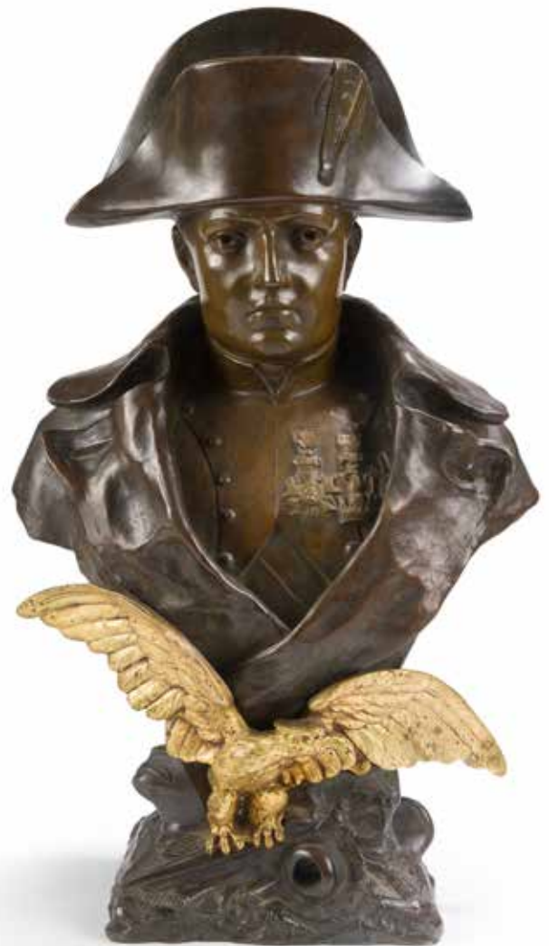
171 RUFFANY L'Empereur Napoléon I er Buste en bronze à trois patines (claire, sombre et dorée), sur embase décorée d'un riche trophée d'armes et de l'aigle impérial doré. Hauteur: 46 cm - Largeur: 38 cm A.B.E. 1 500/2 000€