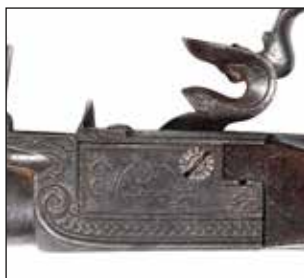
Détail du lot 45

E.M. (manque la vis et la mâchoire, accident mécanique). Époque Premier Empire. 400/500€