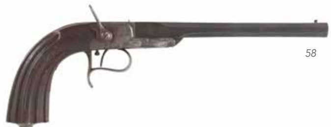
58 PISTOLET DE TIR À PERCUSSION, À CHIEN INTERNE. Canon à pans, rebronzé. Coffre avec restes de gravures et chien sur le côté droit. Détente avec vis de sensibilité. Pontet repose-doigt. Crosse en noyer sculpté. Longueur: 33 cm E.M. (piques). Vers 1850. 150/200€