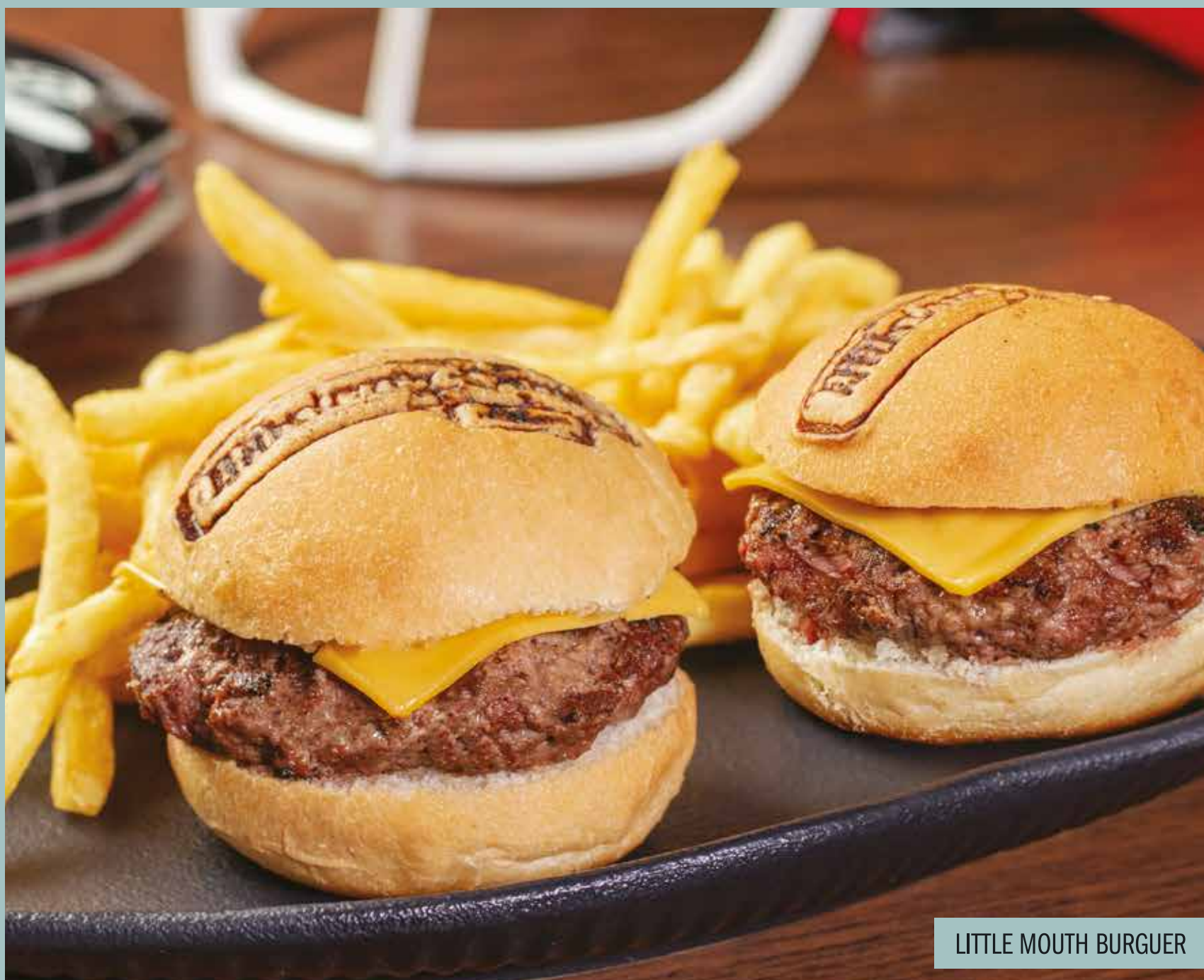
LITTLE MOUTH BURGUER

1 peito de frango grelhado (150g) e salada composta de vagem, cenoura, palmito, cogumelos e tomate cereja.