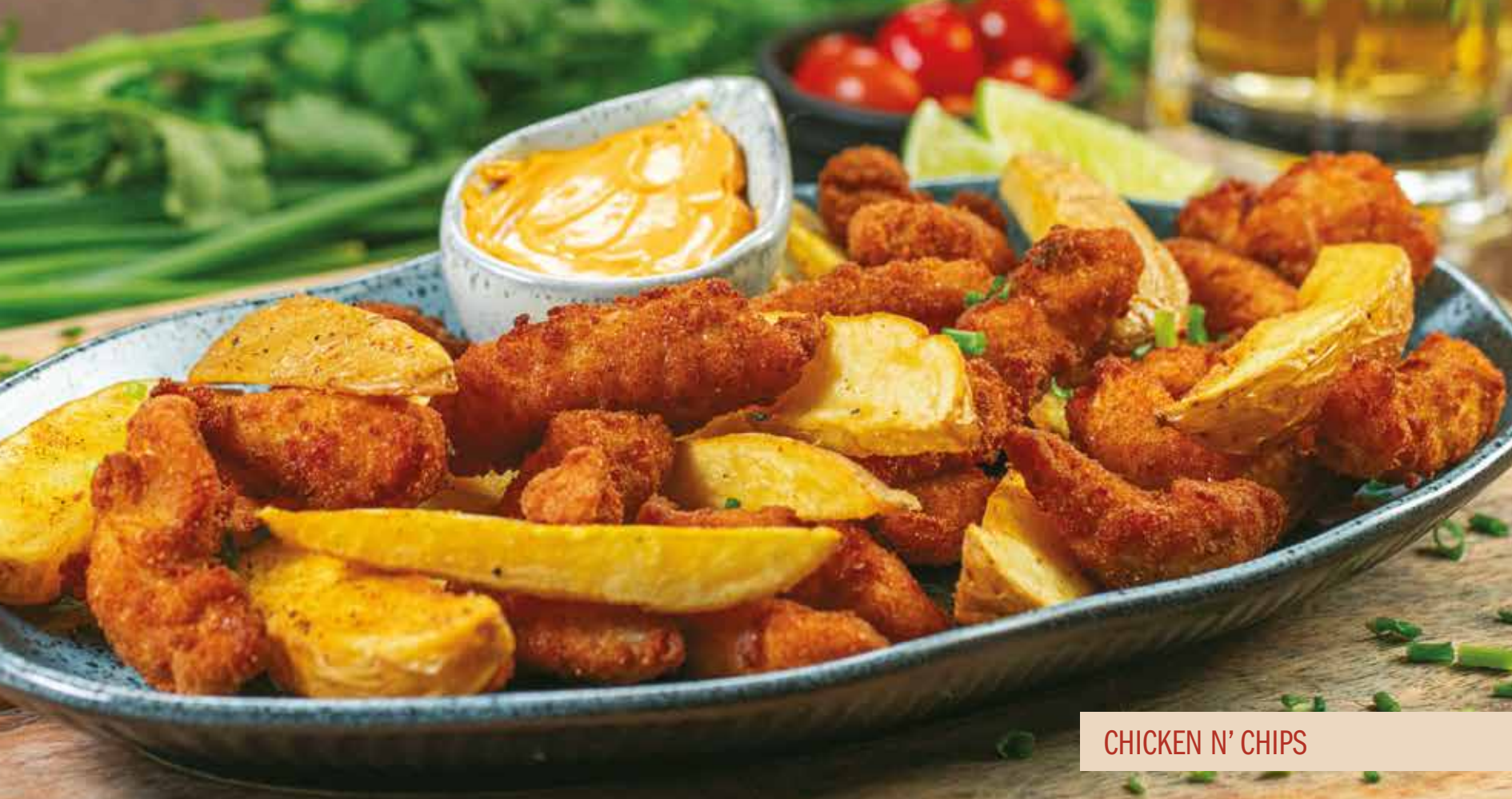
CHICKEN N' CHIPS