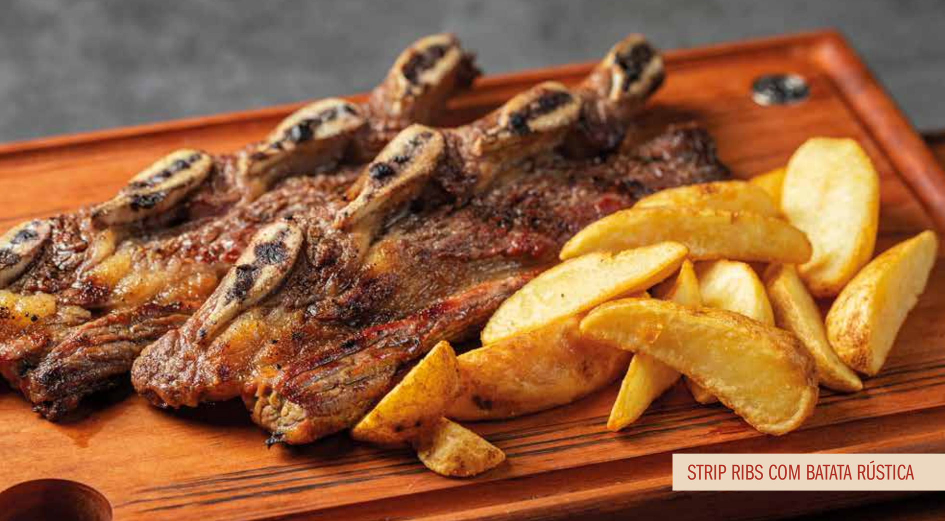
STRIP RIBS COM BATATA RÚSTICA