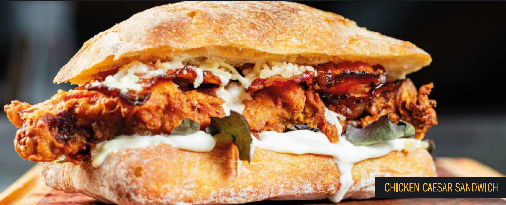
CHICKEN CAESAR SANDWICH

Pão ciabatta, pulled pork, alface americana, muçarela, cebola crispy e maionese especial Mustang Sally.