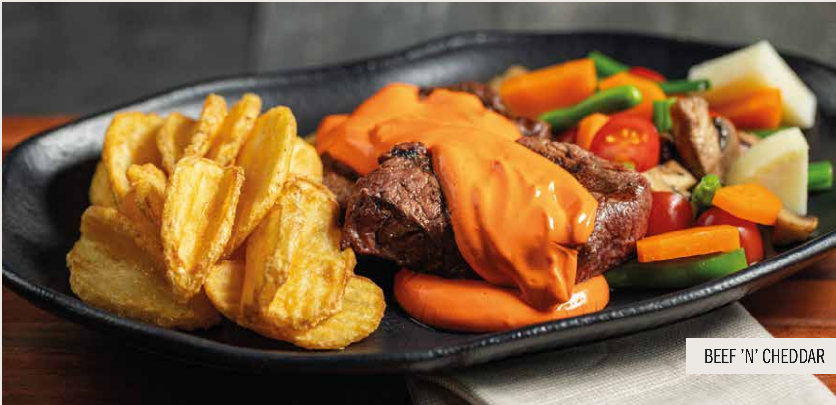
BEEF 'N' CHEDDAR

» MIX DE LEGUMES Salada composta de vagem, cenoura, palmito, cogumelos e tomate cereja.