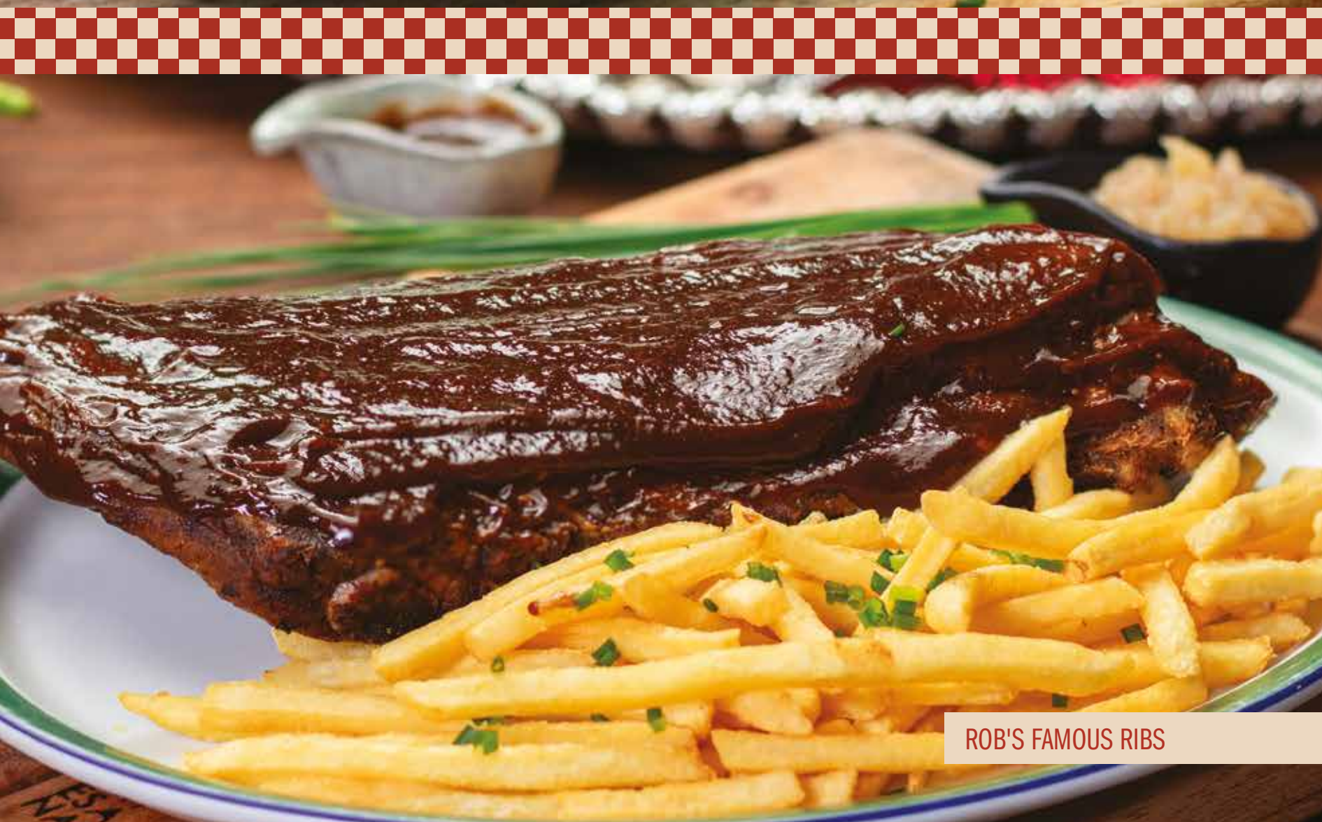
ROB'S FAMOUS RIBS