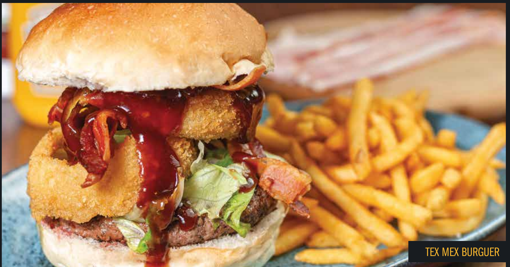
TEX MEX BURGUER

ATENÇÃO ALÉRGICOS: Nossa maionese contém derivados de leite, ovo, soja e crustáceos.