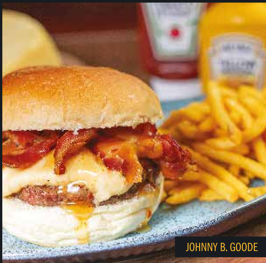
JOHNNY B. GOODE

Pão de fermentação natural, sobrecoxa empanada, alface americana, cream cheese, molho buffalo e maionese especial Mustang Sally. Acompanham fritas.