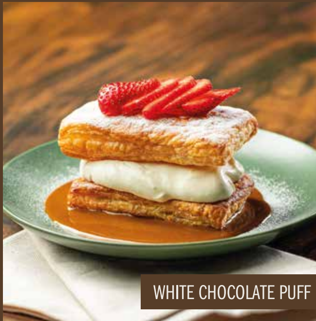
WHITE CHOCOLATE PUFF

Mousse de chocolate branco entre camadas de massa folhada, coberta com morangos frescos e polvilhada com açúcar de confeiteiro. Tudo sobre uma generosa calda de doce de leite.