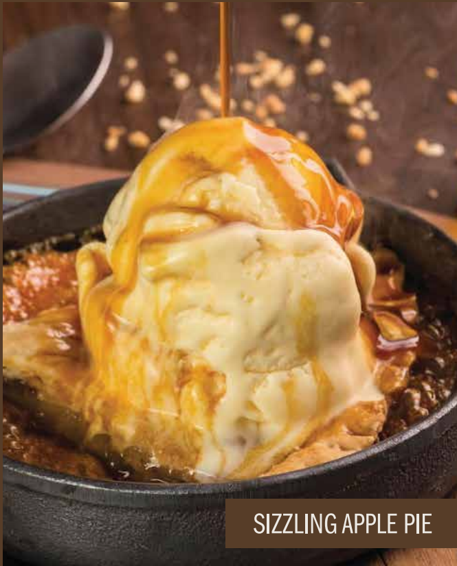
SIZZLING APPLE PIE