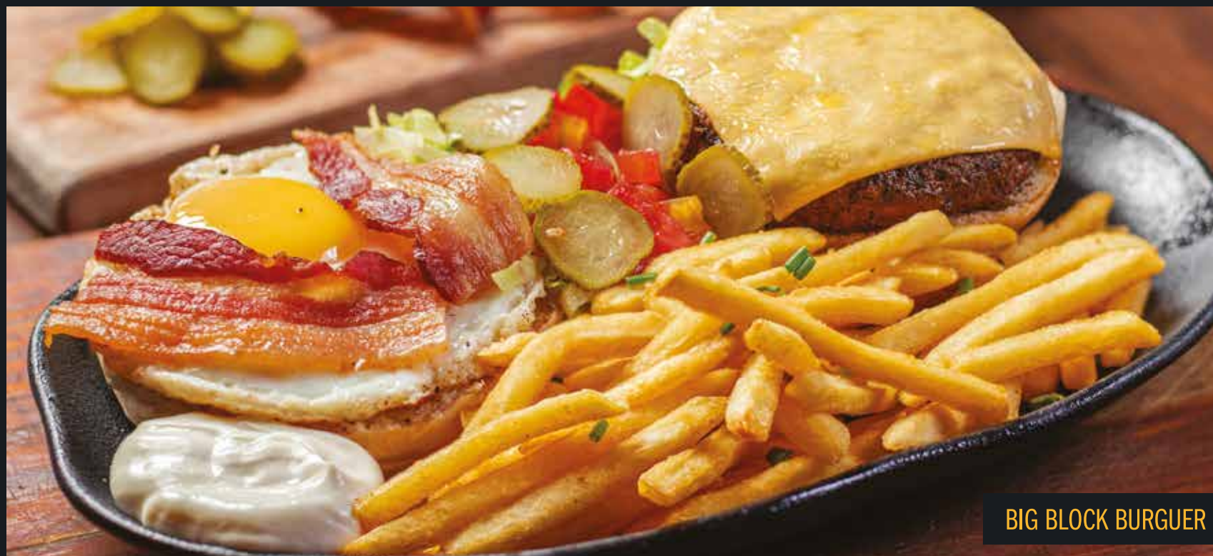
BIG BLOCK BURGUER

OPÇÃO VEGGIE: QUALQUER UM DOS NOSSOS BURGERS PODE VIR COM NOSSA OPÇÃO VEGGIE (BURGER DE PROTEÍNA DE SOJA COM MIX DE VEGETAIS) OU PEITO DE FRANGO GRELHADO.