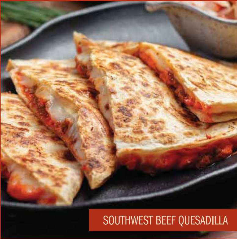
SOUTHWEST BEEF QUESADILLA