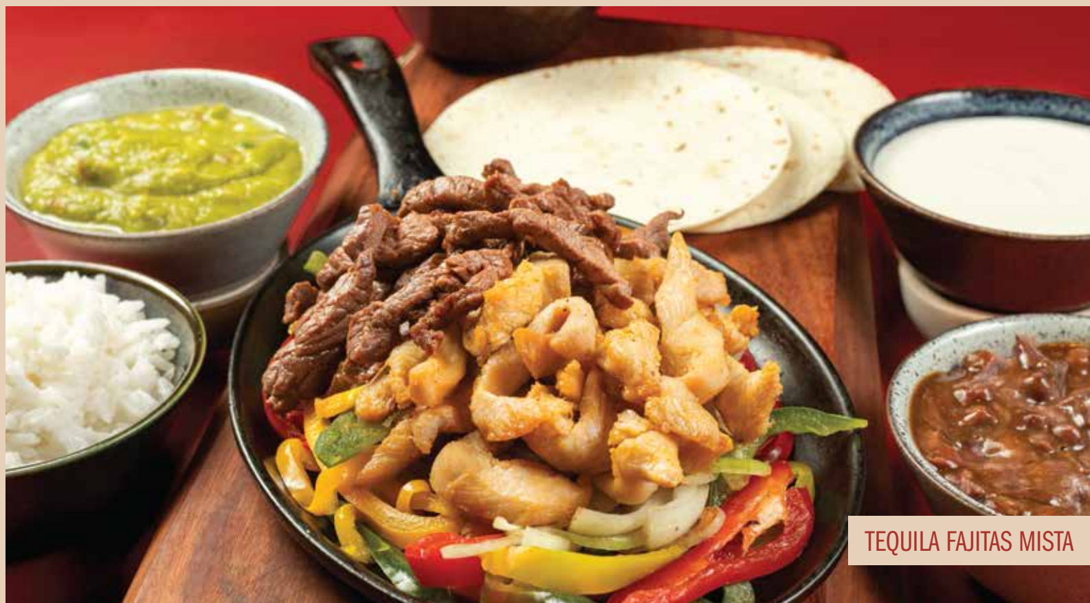
TEQUILA FAJITAS MISTA