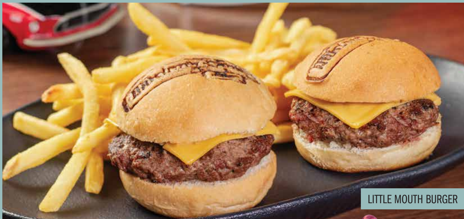
LITTLE MOUTH BURGER