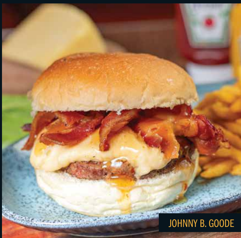
JOHNNY B. GOODE

Pão de fermentação natural, sobrecoxa empanada, alface americana, cream cheese, molho buffalo e maionese especial Mustang Sally. Acompanham fritas.