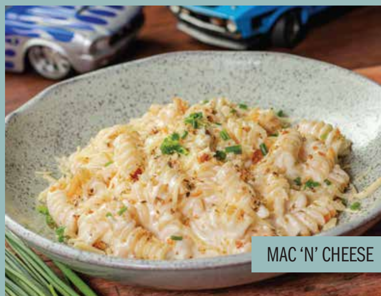
MAC 'N' CHEESE