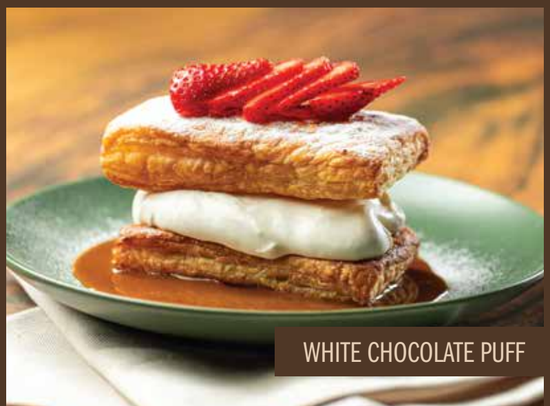
WHITE CHOCOLATE PUFF