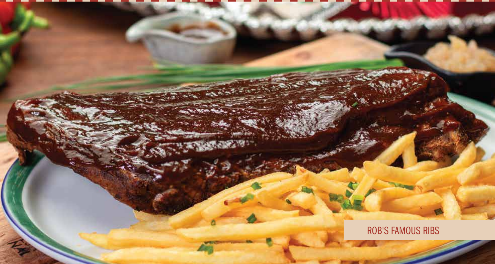
ROB'S FAMOUS RIBS