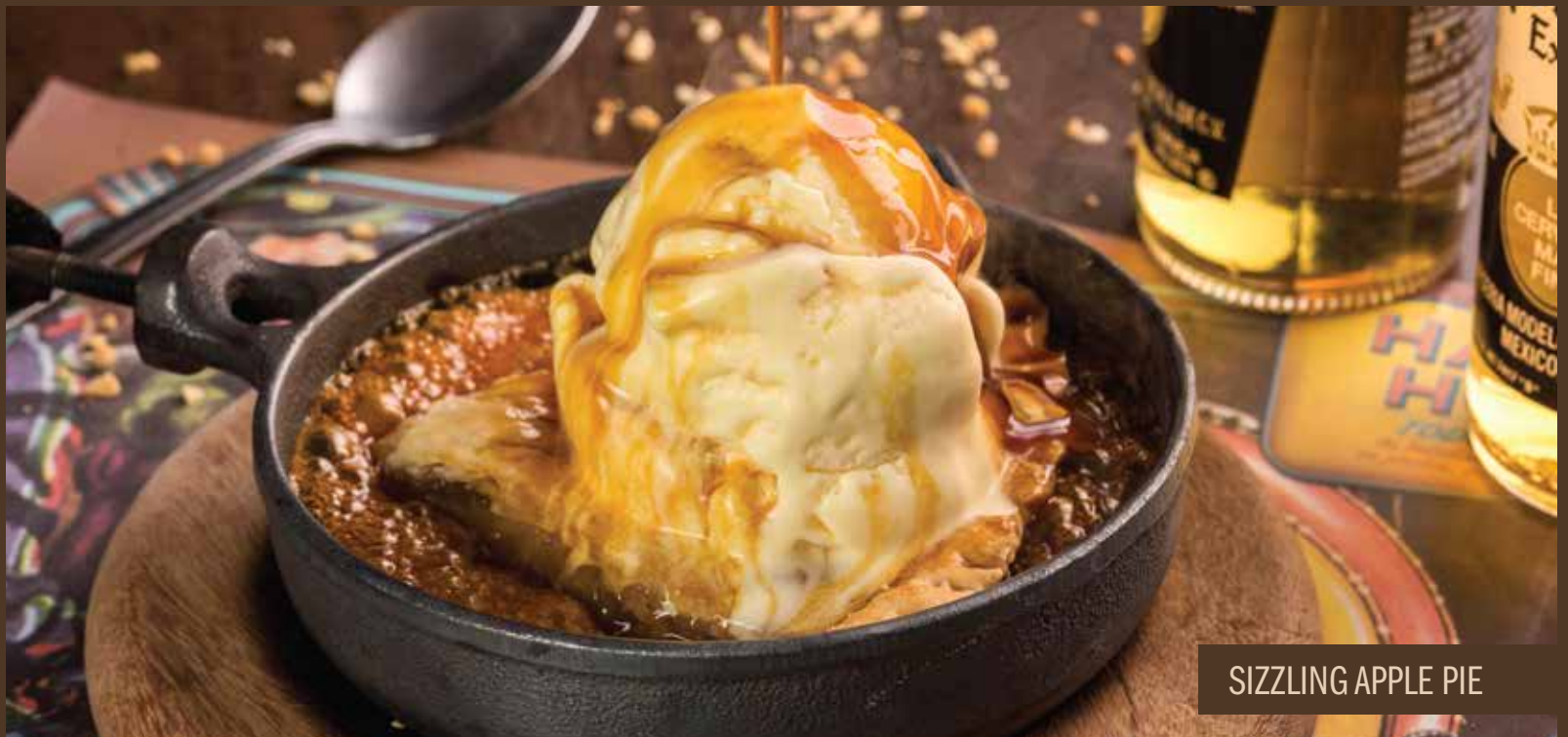
SIZZLING APPLE PIE