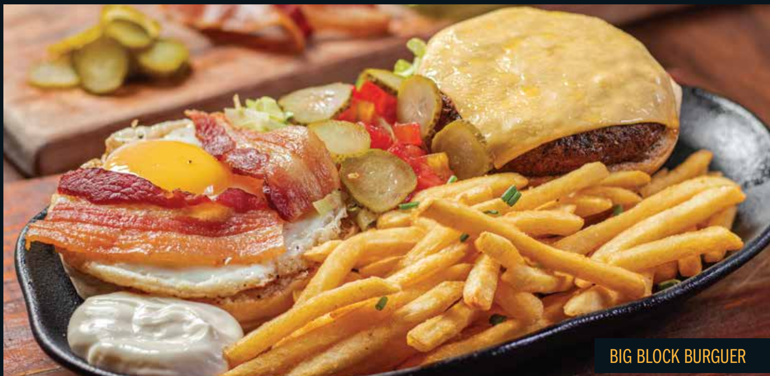
BIG BLOCK BURGUER