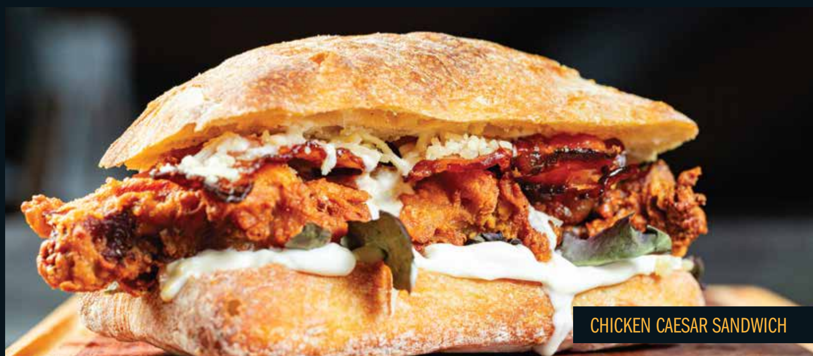
CHICKEN CAESAR SANDWICH

Pão ciabatta, iscas de carne bovina com creme de queijos, cebola crispy e maionese especial Mustang Sally.