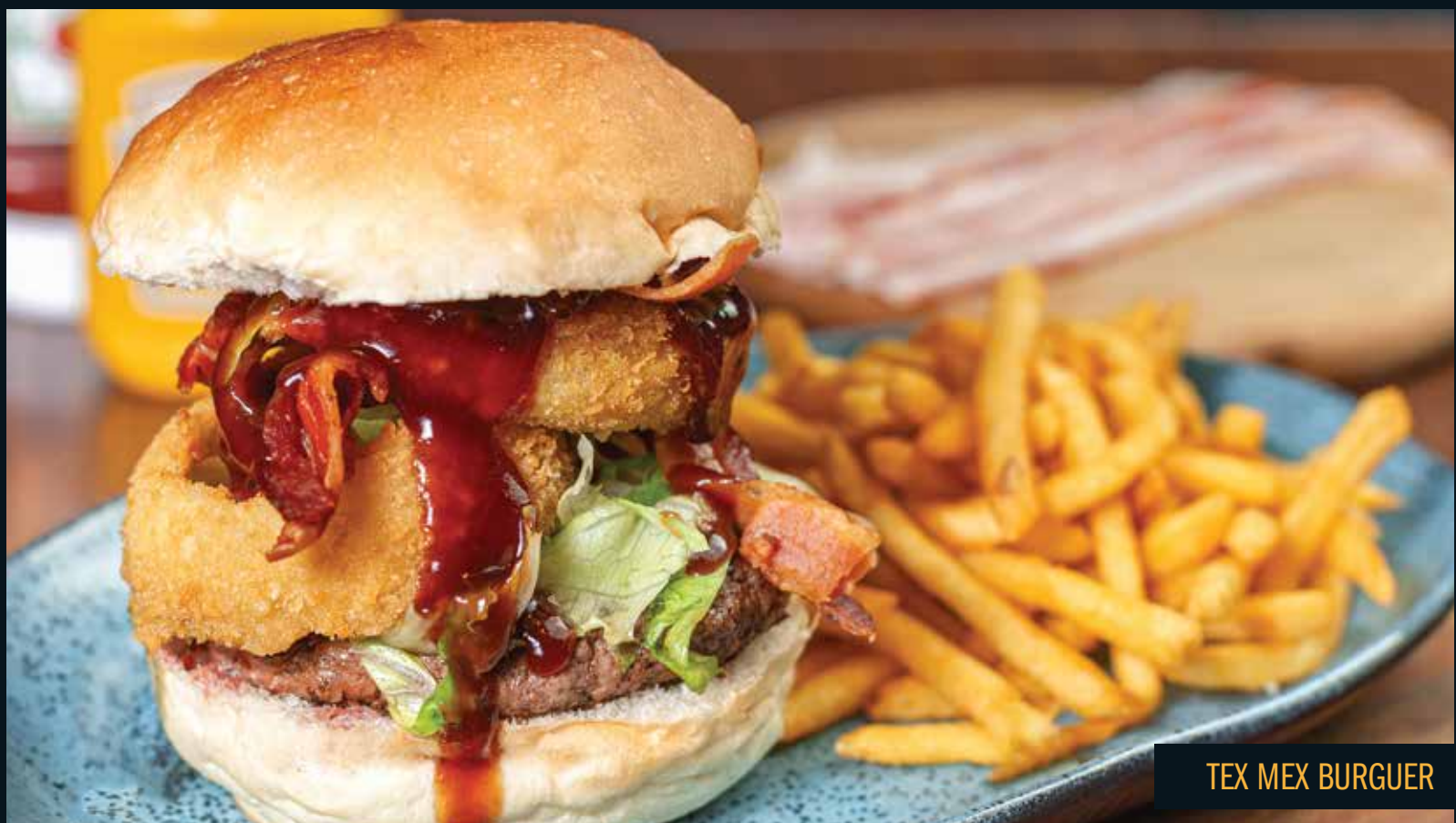
TEX MEX BURGUER

ATENÇÃO ALÉRGICOS: Nossa maionese contém derivados de leite, ovo, soja e crustáceos.