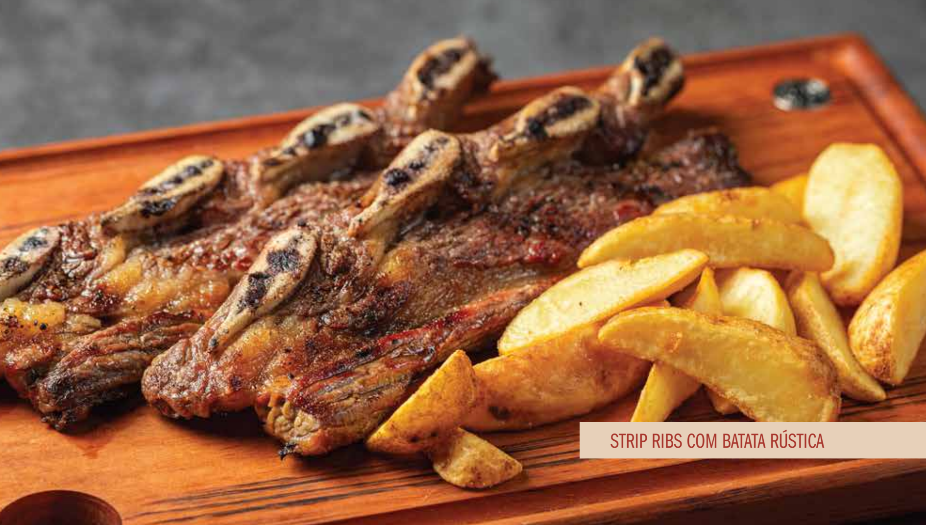
STRIP RIBS COM BATATA RÚSTICA