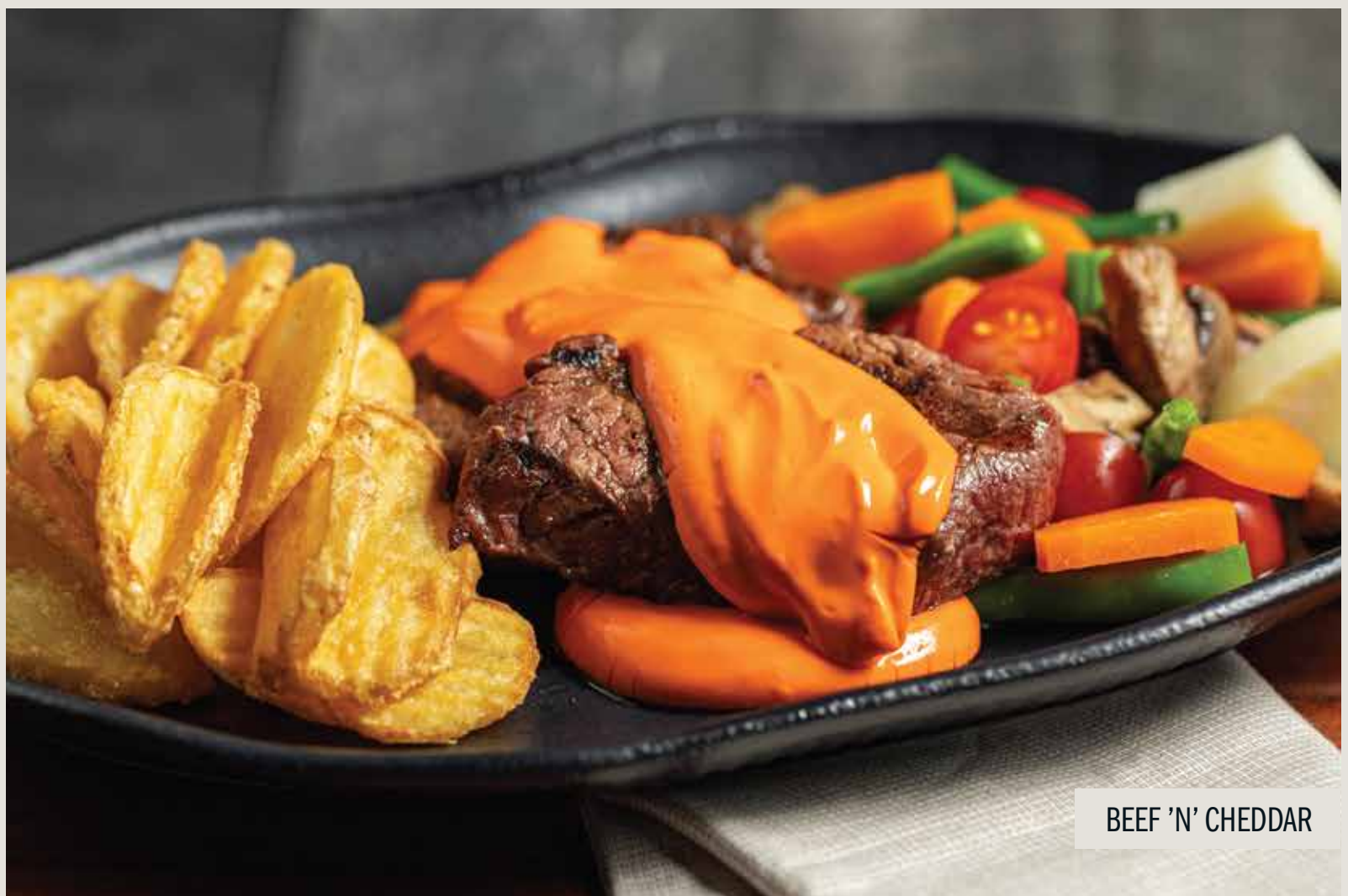
BEEF 'N' CHEDDAR

Delicie-se com a perfeição do nosso gnocchi de batata, acompanhado por suculentas tiras de carne bovina grelhados, envoltos no irresistível molho de gorgonzola.