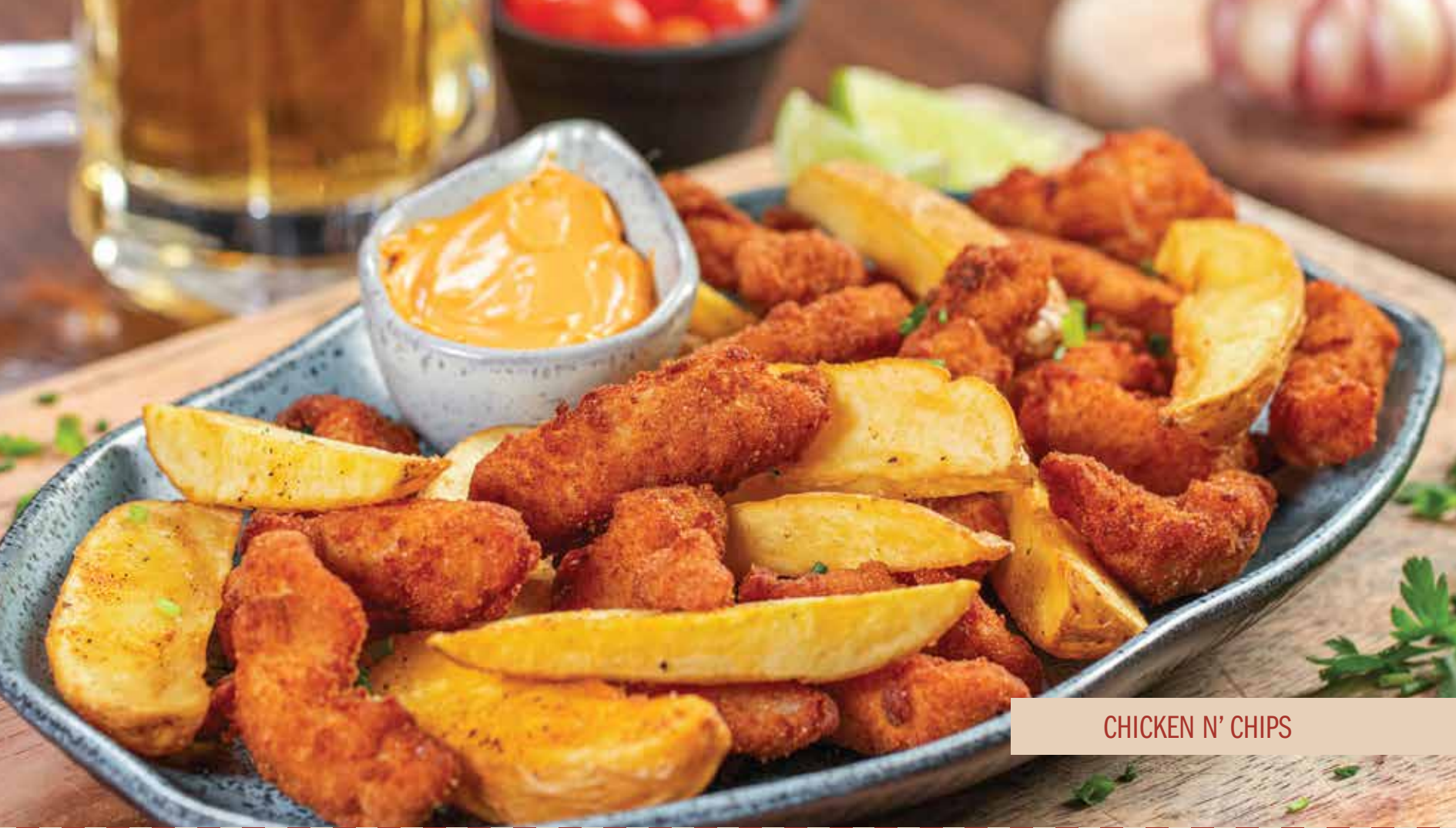
CHICKEN N' CHIPS