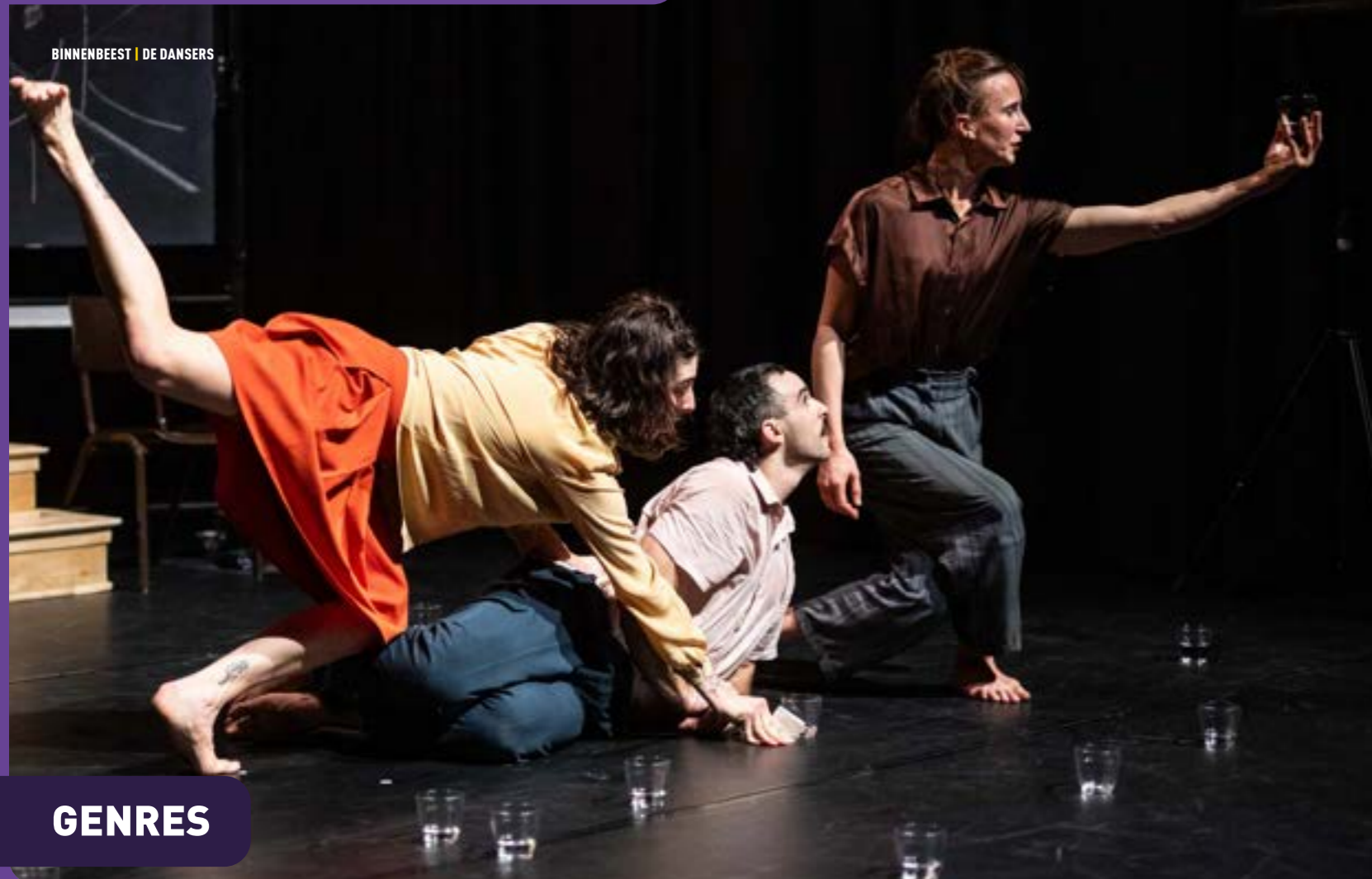
BINNENBEEST | DE DANSERS