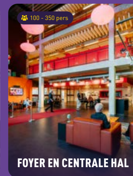
FOYER EN CENTRALE HAL