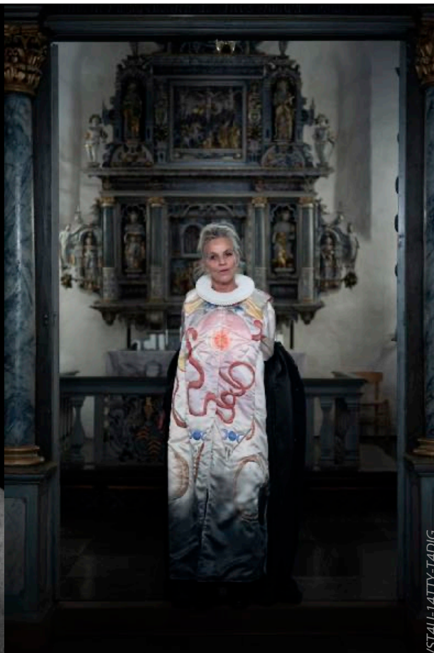
Kulturarrangementer på Teater scenen om "tro og tvivl"