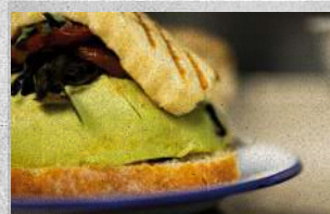
Sandwich de palta