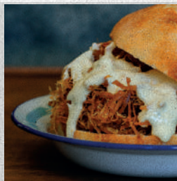
Sandwich de charque