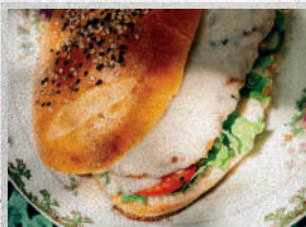
Sandwich de pollo