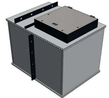
Standardschacht Basis Solid 3200 Innenlänge = 1.85 m