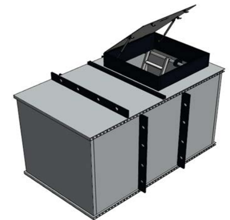
Standardschacht Basis Solid 5000 Innenlänge = 2.35 m