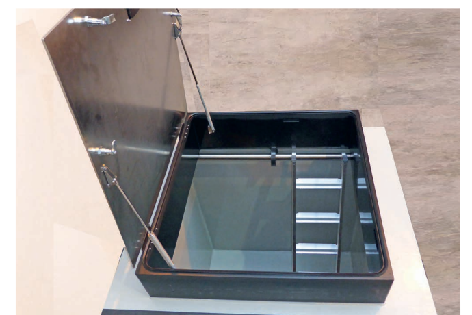
Deckelsystem Komfort mit Chromstahldeckel