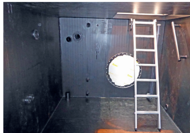
PE-Technikraum mit 5000-Liter-Tank und Mannloch