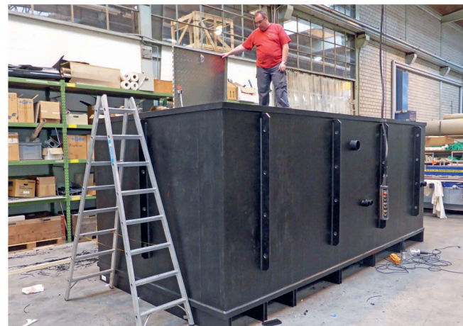
PE- Technikraum 6 x 3 x 2,5 m

Im Gegensatz zu einem betonierten Schacht wird durch das Verschweissen der Wände absolute Dichtigkeit erzielt. Dies gewährleistet einen sanierungsfreien Betrieb auf Jahrzehnte. Die Anschlüsse für die Pumpen- und Filterleitungen sowie die Verrohrung für die Kanalisation werden ebenfalls dicht in die Wände eingeschweisst.