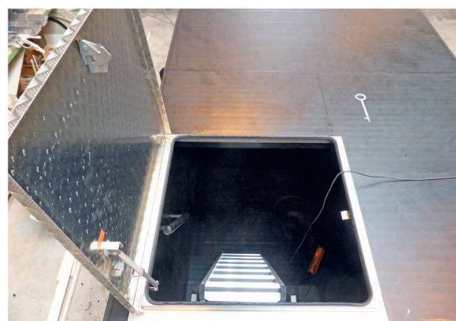
Einstiegsöffnung mit wählbaren Deckelsystemen