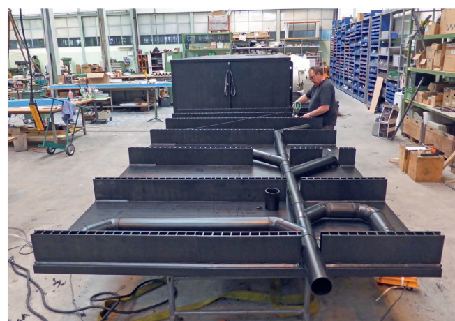
Kanalisationsverrohrung unter dem Boden