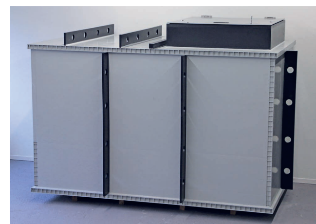
Standardschacht Basis Solid 5000 mit Deckelsystem Komfort