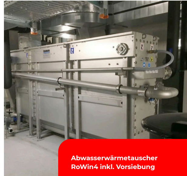
Abwasserwärmetauscher RoWin4 inkl. Vorsiebung