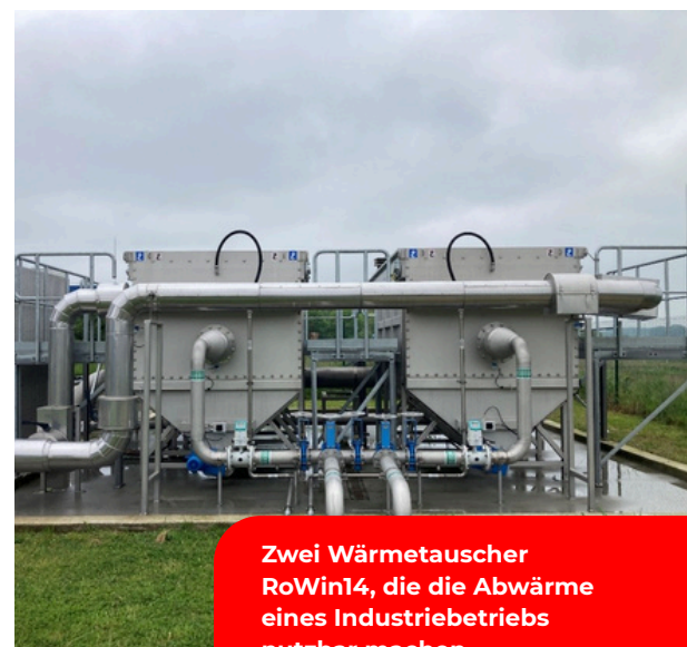
Zwei Wärmetauscher RoWin14, die die Abwärme eines Industriebetriebs nutzbar machen