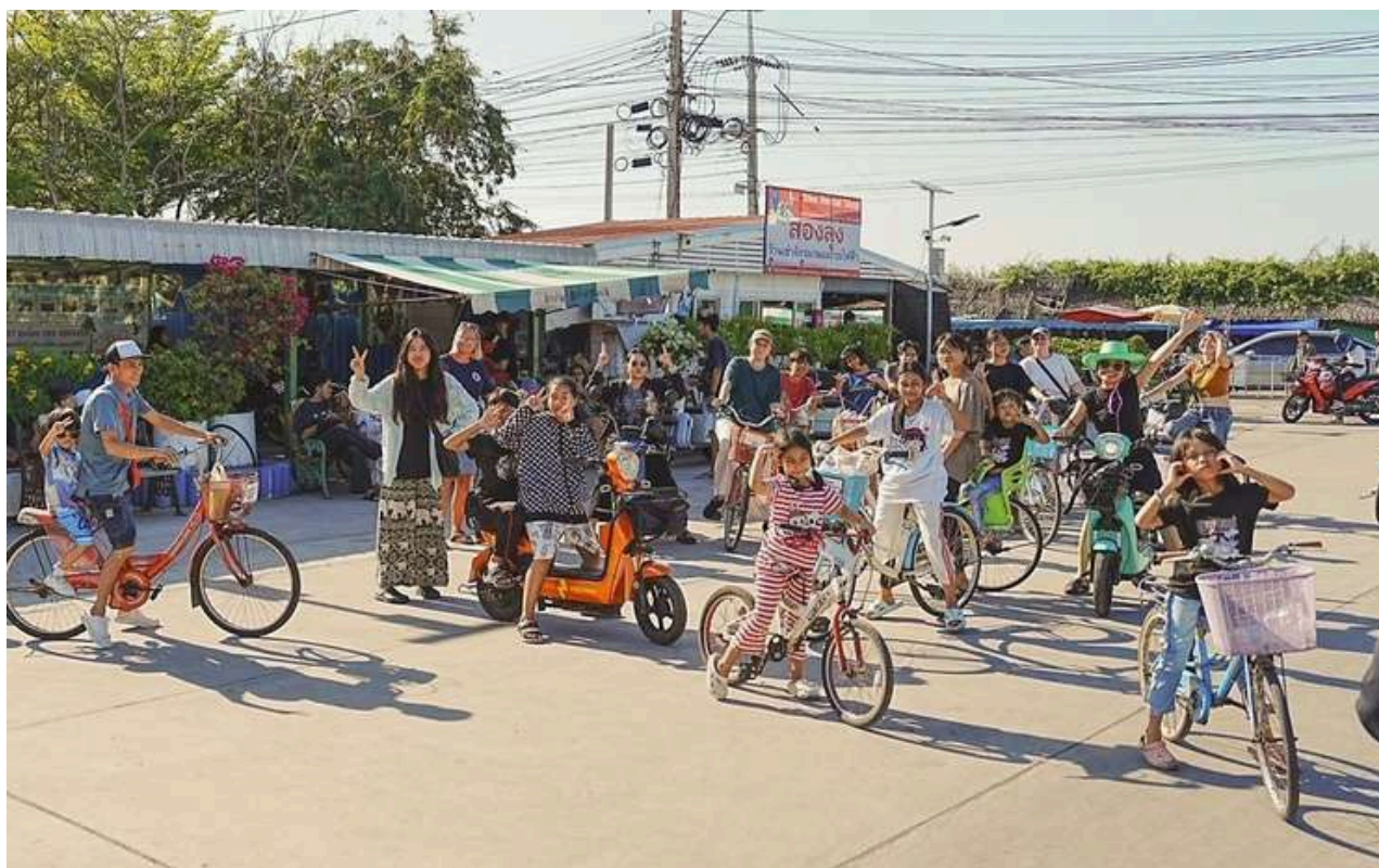
Her er lørdagsklubben på sykkeltur.

På lørdagsklubben har de både andakt, musikktimer og engelskundervisning. Og av og til drar de på tur.