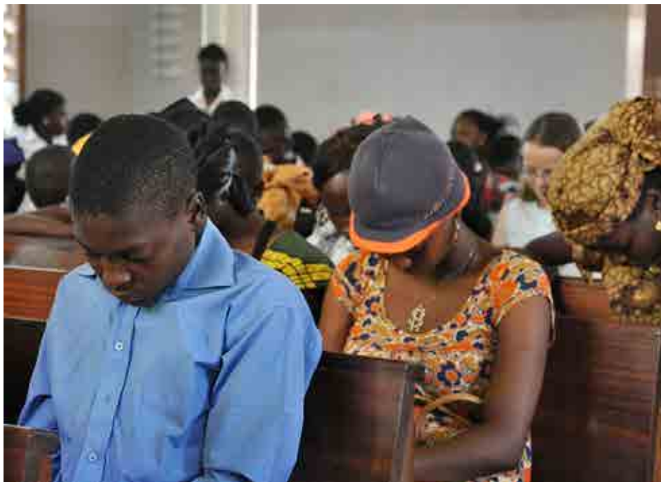
For kristne i Kamerun er bønne viktig. Her er Espace Jeunes (en ungdomsgruppe) samlet til bønnemøte.

- Det ligger en hemmelighet i å be sammen med andre kristne. For når vi ber sammen, oppstår det også et fellesskap mellom oss. På mange måter er bønn en nøkkel til kristent fellesskap.