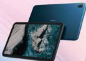
NOKIA T20 Wi-Fi (4G)