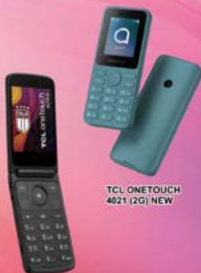
TCL ONETOUCH 4021 (2G) NEW