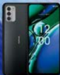
NOKIA 643 (5G)