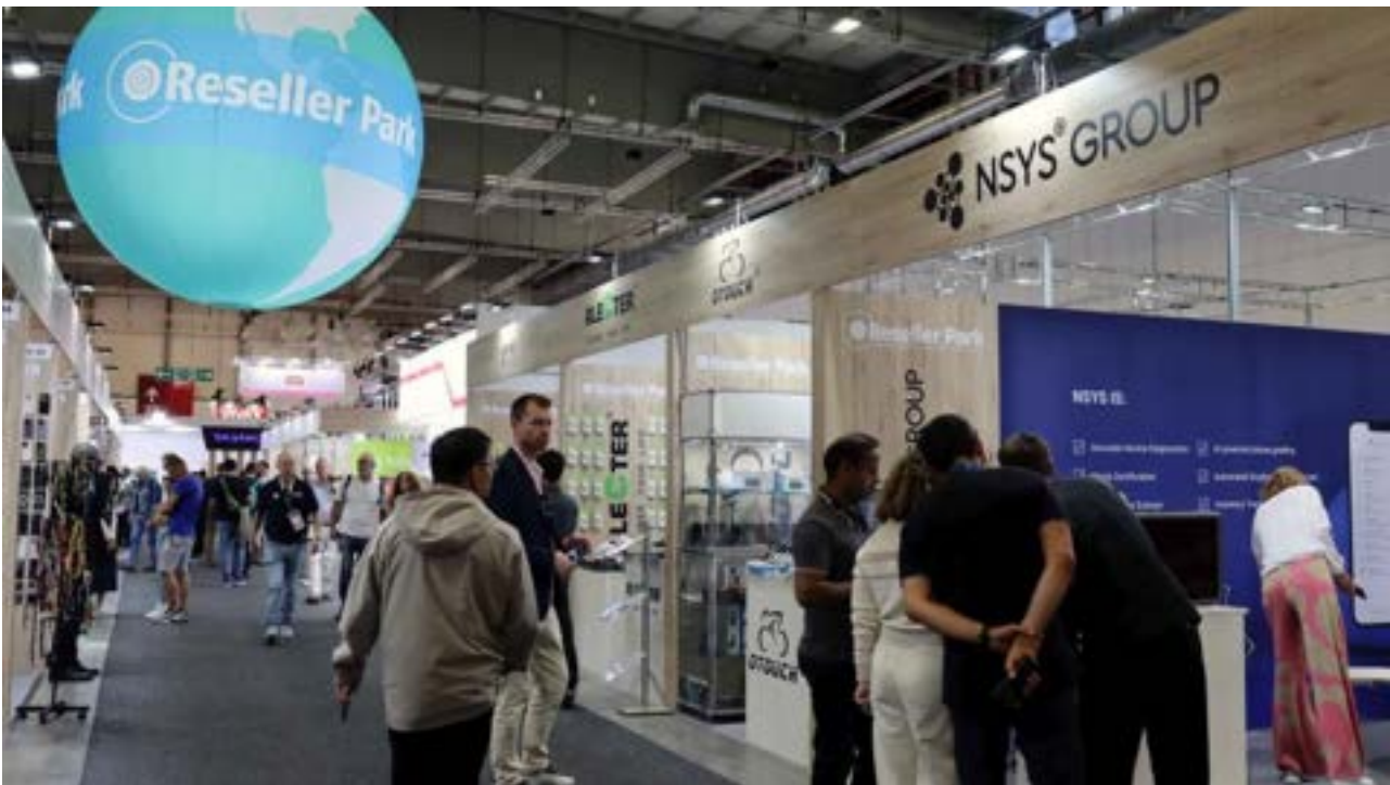
Der Reseller Park wird auf der IFA 2024 die komplette Halle 25 belegen.

Nintemann: Der Reseller Park hat traditionell einen hohen internationalen Ausstelleranteil von etwa 60 Prozent. Diese sind natürlich für die deutschen Absatzkanäle, aber auch für den europäischen Gesamtmarkt, interessant. Durch die internationale Ausstellerstruktur aus über 50 Ländern, ist der Reseller Park aber auch interessant für deutsche Anbieter zum Export in die ganze Welt im B2B-Segment. Durch die politische Weltlage beispielsweise durch das Lieferkettengesetz oder ESG- und CSRD-EU-Regularien, deuten sich leichte Verschiebungen in den internationalen Herstellungs- und Vermarktungsstrukturen an und den Klima- und Umweltherausforderungen. Die Produktionsstätten verlagern sich tendenziell wieder mehr nach Europa und der gesamte Distributionsmarkt wird zunehmend nicht nur europäisiert, sondern auch internationalisiert.