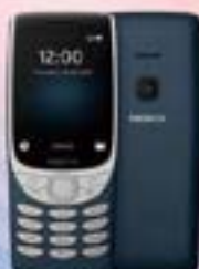
NOKIA 8210 (4G)