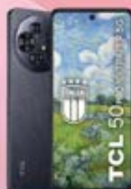
TCL 50 PRO NXPAPER (5G) NEW