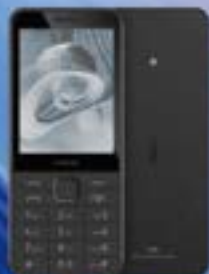
NOKIA 235 4G (2024)