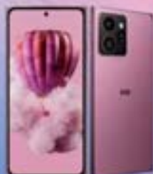
HMD SKYLINE (5G)