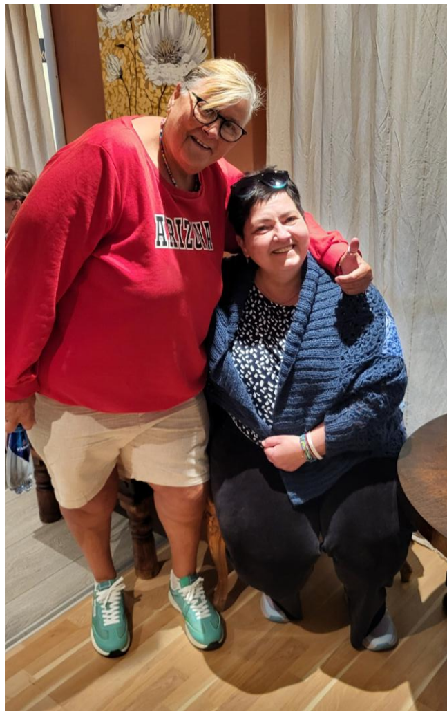
Personene på bildet har ingen sammenheng med teksten.