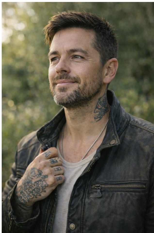
KI generert illustrasjonsbilde