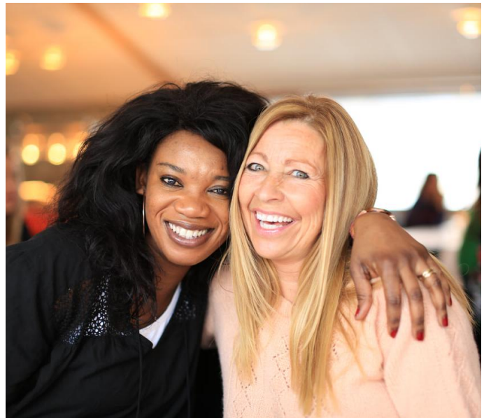
Personene på bildet har ingen sammenheng med teksten.