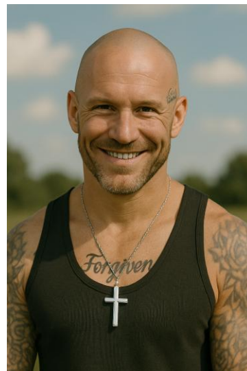
Av personvern hensyn er bildet en KI-generert illustrasjon

Ettervernsprogrammet vårt er fortsatt under utvikling, og vi er i en fase av å etablere et fast samarbeid med Kriminalomsorgen og Friomsorgen, for å sikre at vi når ut til målgruppen.