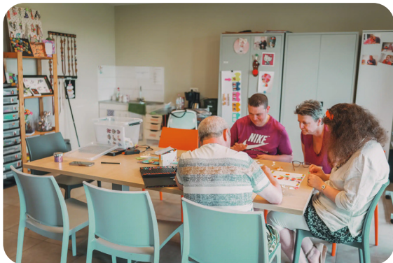
Formation à la demande pour le personnel éducatif. SRA « La Houblonnière ».