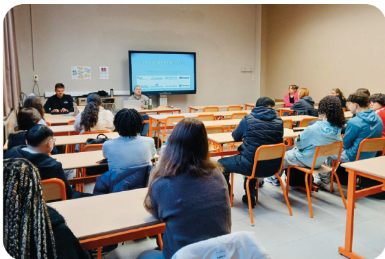
Session de sensibilisation pour des élèves de 3 ème secondaire. Athénée Royal de Mons.