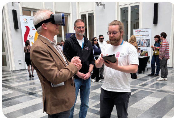
Colloque « Cécité & malvoyance ». Parlement de la Fédération Wallonie-Bruxelles.