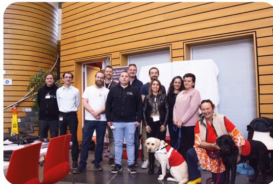
Session de sensibilisation pour les collaborateurs. DOW Silicone Belgium.