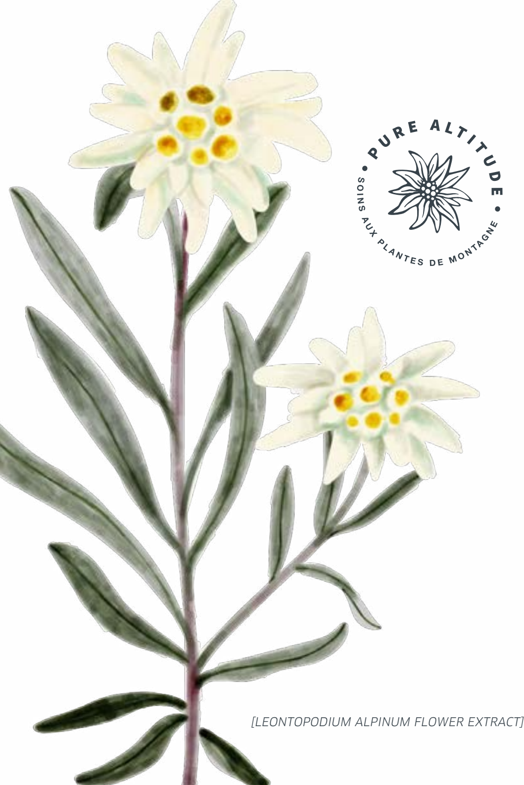
[LEONTOPODIUM ALPINUM FLOWER EXTRACT]

JOCELYNE SIBUET - Fondatrice de Pure Altitude