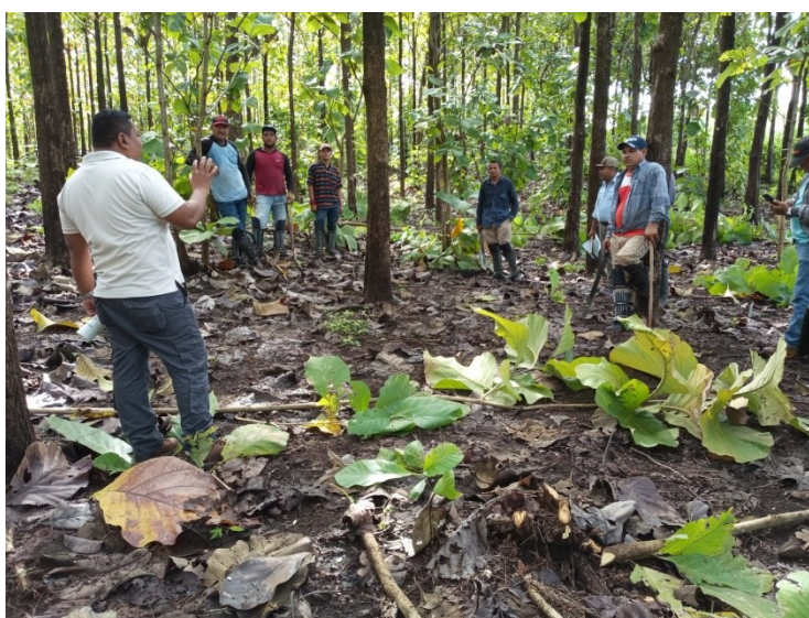
Foto tomada el 21 de octubre del 2025, Presentación de metodología de la encuesta.