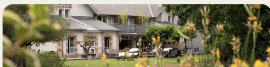
Tableau de Bord - Les Propriétés

Ce qu'il vous reste à compléter pour accueillir vos premiers clients : Tout est en ordre