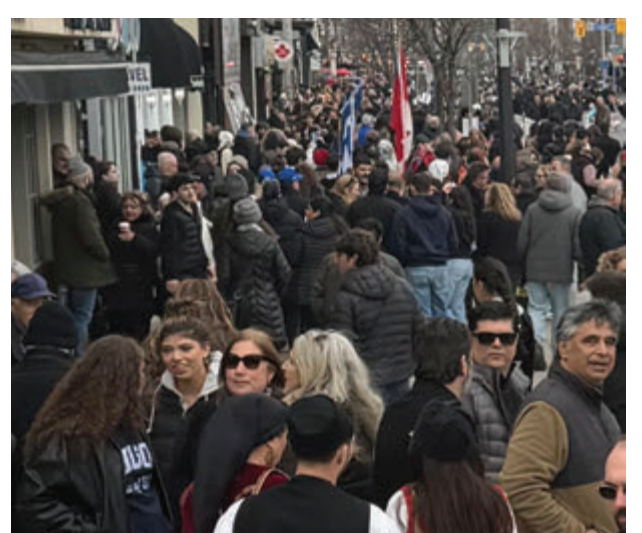
Σαγμύτιπο από τις ομογενειακές εκδηλώσεις για την επέτειο της εθνικής παλιγγενεσίας από την Λεωφόρο Ντάνφορθ, Την μικρή Ελλάδα του Τορόντο

κνύοντας τη συνέχεια της εθνικής συνειδήσης μέσω της συμμετοχής. Ιδιαίτερα αισθητή ήταν η παρουσία των μαθητών, οι οποίοι παρήλασαν κρατώντας ελληνικές σημαίες, ενώ πολλοί έφεραν παραδοσιακές ενδυμασίες από διαφορετικές περιοχές της Ελλάδας.