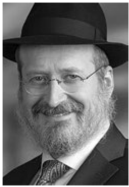
Ραβίνος Mendy Chitrik, Πρόεδρος της Συμμαχίας των Ραβίνων στα Ισλαμικά Κράτη

Ιστορία του Ραβίνου Mendy Chitrik, Προέδρου και Ιδρυτή της Συμμαχίας των Ραβίνων στα Ισλαμικά Κράτη