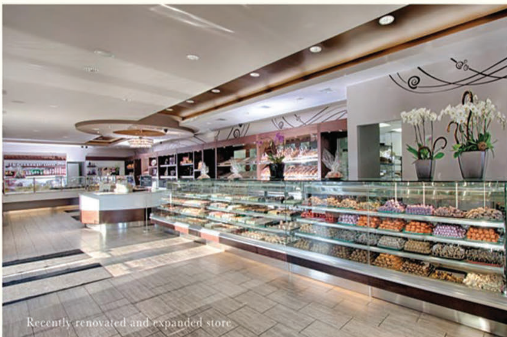
Recently renovated and expanded store