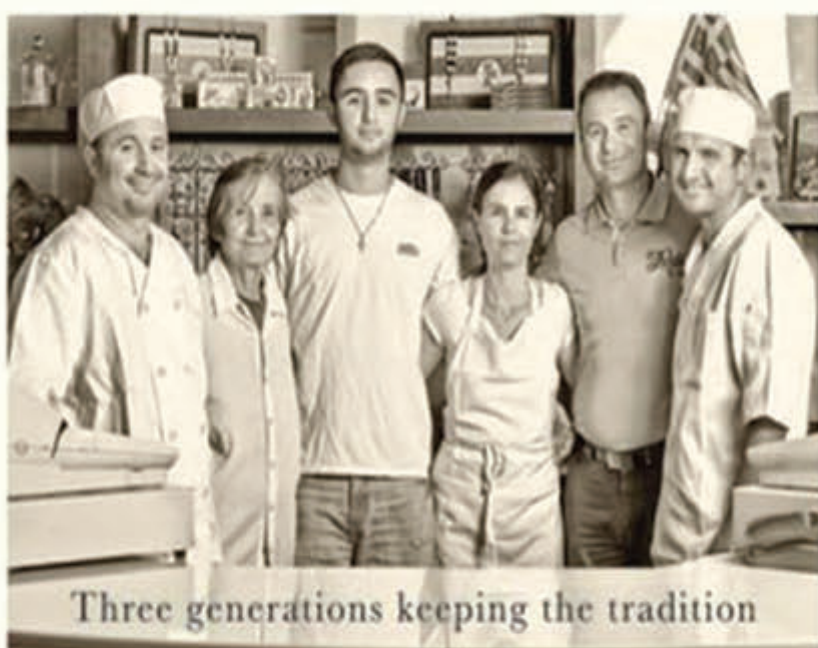
Three generations keeping the tradition