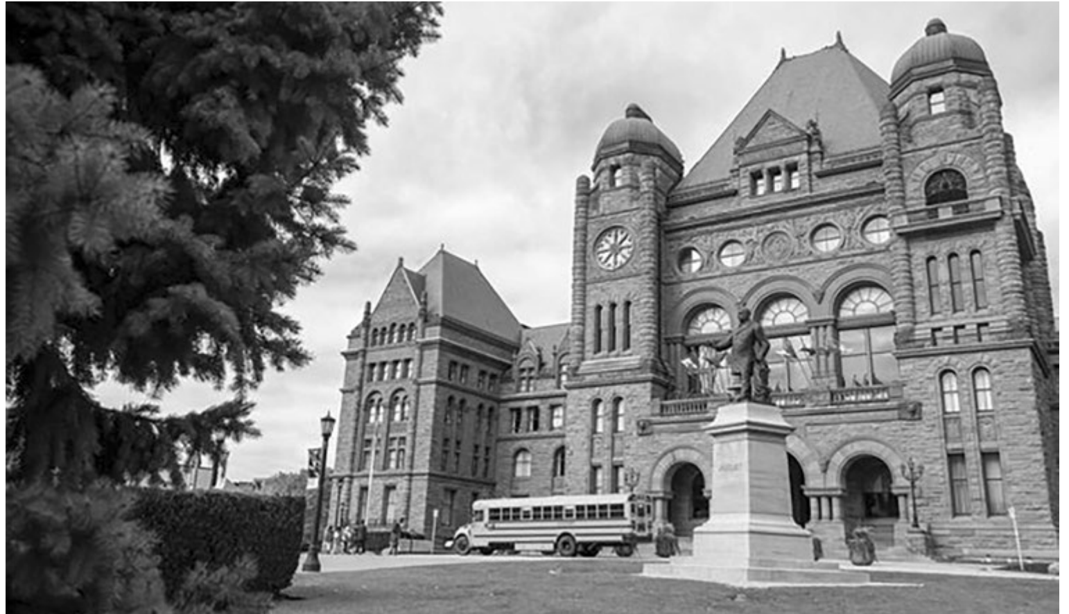
Η Sunshine List του Οντάριο κυκλοφόρησε την Παρασκευή.

Υπάρχουν επίσης 50 άτομα από το γραφείο του πρωθυπουργού στη λίστα φέτος, από 47 το προηγούμενο έτος. Δύο από αυτούς έβγαζαν πε-