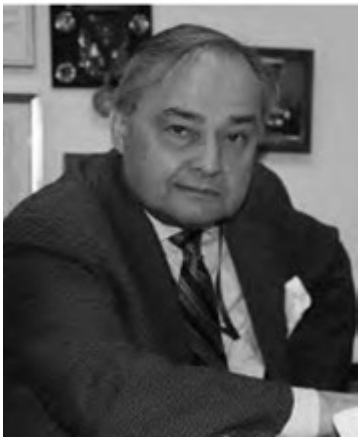
• Του Θωμά Σ. Σάρα

Για τους ιστορικούς αναλυτές, η πτώση της αυτοκρατορικής Ρώμης, είναι συνδεδεμένη με αλαζονικούς και εκτός πραγματικότητας ηγέτες, τύπου Καλιγούλα. Ενός ηγέτη ο οποίος αδίστακτα προσπάθησε να επιβάλει τα σχέδια και τις πολιτικές του, με αποτέλεσμα, η αποτυχία των πολιτικών του αποφάσεων να συμβάλουν στην άμεση πτώση της Ρωμαϊκής αυτοκρατορίας. Κάπως παρόμοιοι υπήρξαν και οι λόγοι, αργότερα του Βυζαντίου με την εμφάνιση των Οθωμανών.