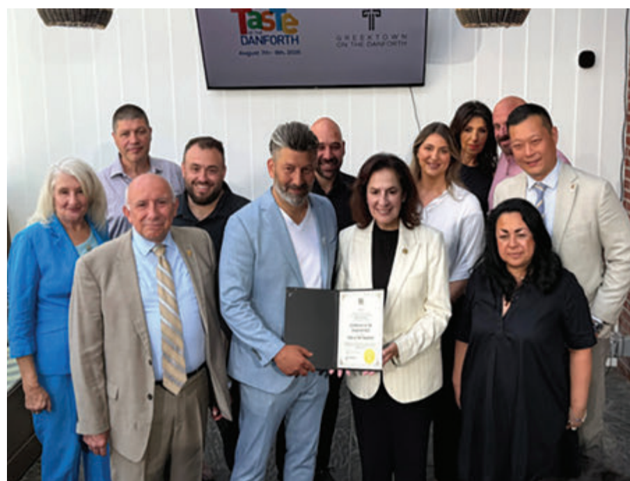
Στιγμιότυπο από την εκδήλωση αναγγελίας της επαναφοράς του Taste of the Danforth, με τον πρόεδρο της περιφέρειας και μέλη του επαρχιακού κοινοβουλίου Έφφ Τριανταφυλοπούλου, τον Άρη Μπαμπικιαν και τον υπουργό Σταν Τσο, καθώς και μέλη του δημοτικού Συμβουλίου του Τορόντο.

Η εκδήλωση αναμένεται να προσελκύσει τουλάχιστον ένα εκατομμύριο επισκέπτες σε τρεις ημέρες από τις 7 έως τις 9 Αυγούστου. Μια πολύ γνωστή γιορτή του ελληνικού φαγητού, του πολιτισμού και της κοι-