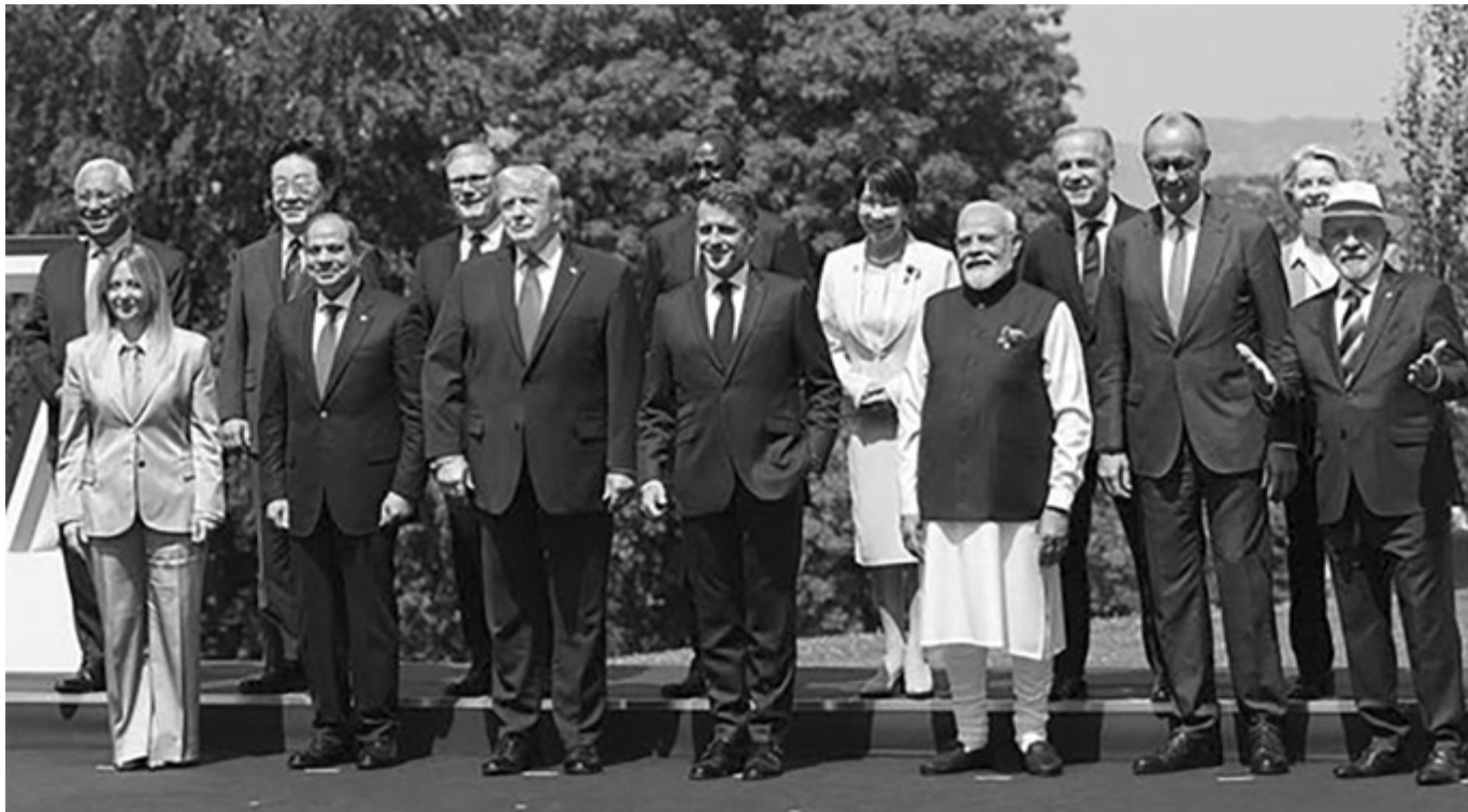
Στη σύνοδο κορυφής της G7 στο Ινιαν, ο πρωθυπουργός του Καναδά έκανε μια εκπληκτική παραδοχή: η παλιά λέσχη των δυτικών δυνάμεων δεν υπαγορεύει πλέον την παγκόσμια τάξη. Και η παρουσία της Ινδίας το αποδεικνύει. «Είναι μια αναγνώριση ότι η G7, αν ποτέ κυβερνούσε τον κόσμο, δεν κυβερνά πλέον τον κόσμο ή προ-σποιείται ότι κυβερνά»