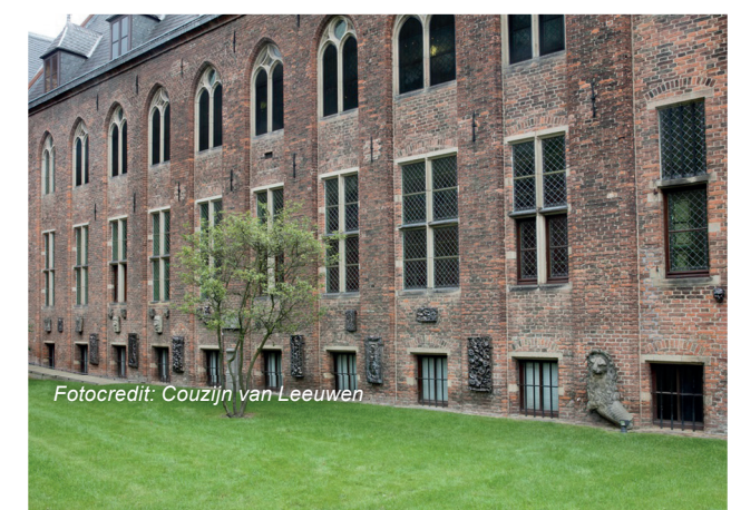
Fotocredit: Couzijn van Leeuwen

Het tweede kunstwerk van Couzijn van Leeuwen zijn de gedenkstenen van keramiek die verwijzen naar het vroegere kerkhof. Van Leeuwen realiseerde zich dat hier vele generaties zijn begraven en maakte deze keramieken 'grafstenen' geïnspireerd door de geschiedenis van deze plek. Op één van de stenen zie je bijvoorbeeld skeletten en andere details die naar de dood verwijzen. Maar Van Leeuwen voegde ook een haas toe. Hij noemt de haas een nieuwe bewoner van de tuin. Zonder die haas zou het allemaal té dood en té zwaar worden, vond hij. Bekijk de stenen vooral van dichtbij voor de bijzondere details.