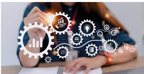
Tableau des AAP et AMI