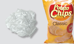
Bolsas y envoltorios plásticos

Recolecta los desechos de basura en una bolsa de basura o en un contenedor de basura.