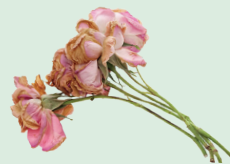
Flores y restos de plantas