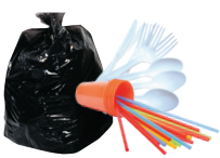
Vajilla y vasos para beber