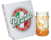
Reciclables sucios con comida