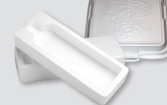
Espuma de poliestireno

Los desechos de mascotas deben estar en una bolsa