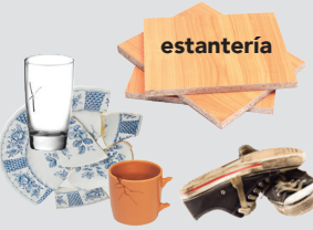
Desechos domésticos varios

MANTÉN ESTOS ELEMENTOS FUERA DEL CONTENEDOR PARA BASURA.