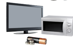
Materiales peligrosos y desechos electrónicos