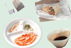
Papel sucio con comida