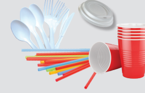
Utensilios, tapas y sorbetes plásticos