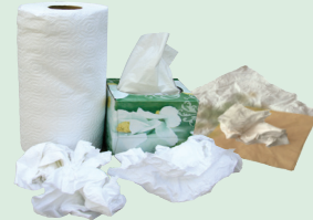
Servilletas, toallas y pañuelos de papel

Todo el material colocado en el contenedor para compost se convierte en compost que se usa para nutrir tierras agrícolas locales. Coloca UNICAMENTE desechos alimentarios, papel sucio con comida y residuos de plantas en el contenedor para compost.