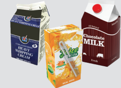
Cajas para beber y cajas de bebidas enceradas