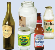
Botellas y frascos de vidrio