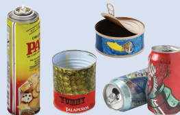
Latas de aerosol y metálicas

MANTÉN ESTOS ELEMENTOS FUERA DEL CONTENEDOR PARA RECICLAR.