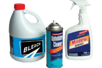
Limpiadores domésticos y sustancias químicas