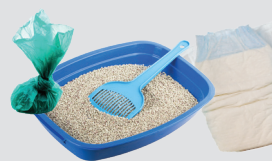
Pañales y desechos de mascotas

Los desechos de mascotas deben estar en una bolsa