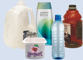
Botellas y recipientes plásticos