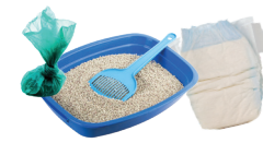
Pañales y desechos de mascotas