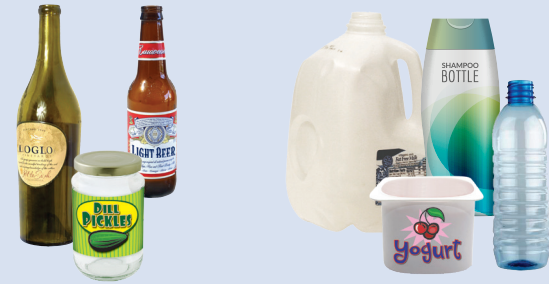
玻璃瓶罐 塑料瓶和容器