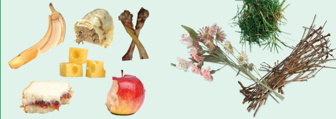
食物残渣 庭院修剪物