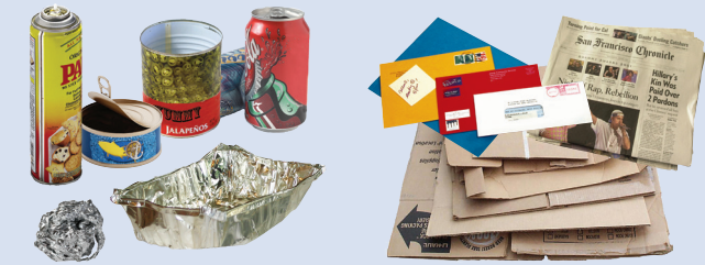
金属与铝制品 清洁的纸制品