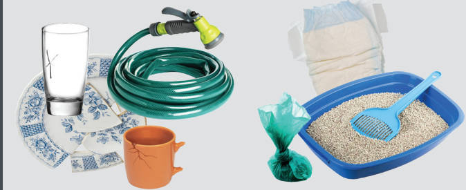
其他生活垃圾 宠物粪便和尿布