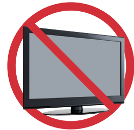
禁止投放电脑、显示器或电视机