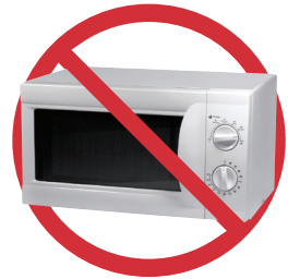
禁止投放电器或电子产品/电子垃圾