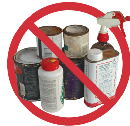
禁止投放化学清洁剂、油漆、溶剂或其他有毒化学品