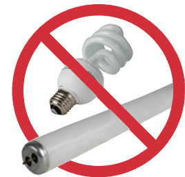
禁止投放荧光灯管或节能灯泡