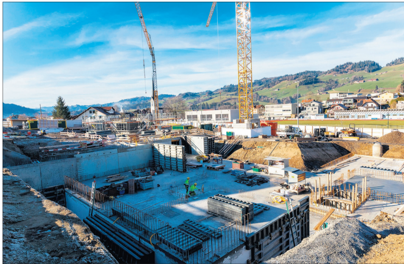
Keine weissen Weihnachten, aber dafür schreitet der Bau weiter zügig voran.

Doch nicht nur die Bedürfnisse der Bewohnerinnen und Bewohner müssen beim Bau berücksichtigt werden. Für den Ersatzneubau wurde auch eine Nutzergruppe in die Planungsorganisation installiert. Die Bereichsleitenden aus der Pflege, Hauswirtschaft, Technischem Dienst und Gastro sind seit Planungsstart mit an Bord. Diese Gruppe begleitet die Planung und stellt sicher, dass neben der Umsetzung der Raumbedürfnisse auch die Arbeitsprozesse im neuen Gebäude effizient ablaufen werden. Dabei spielt unter anderem das Musterzimmer eine bedeutende Rolle.