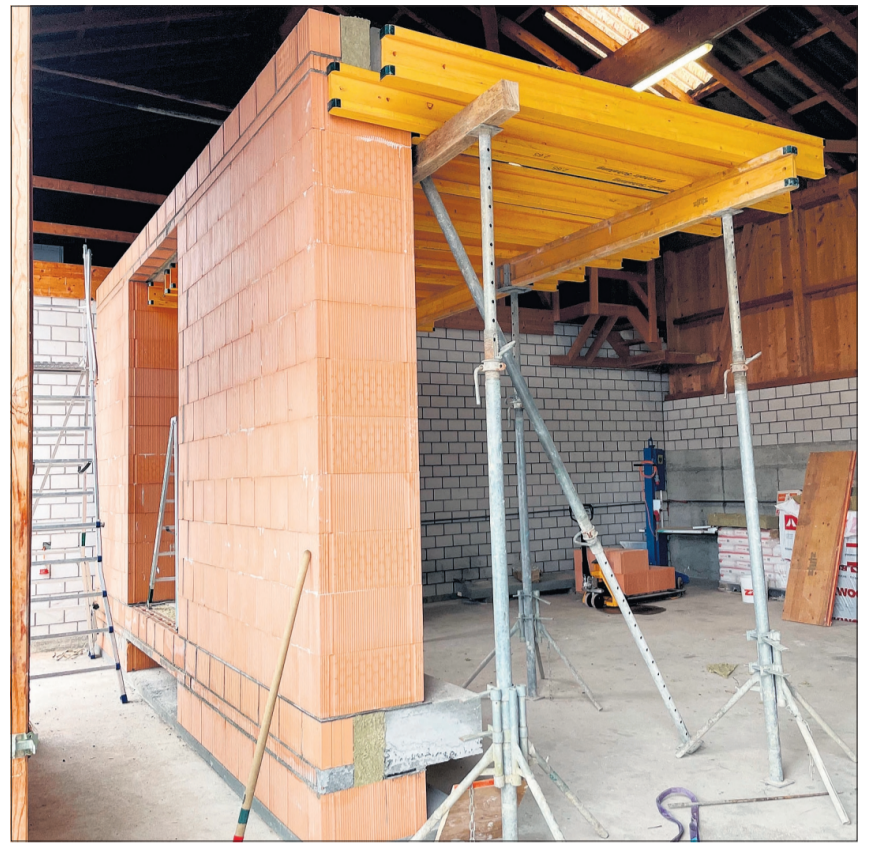
Vom Musterzimmer steht die Aussenmauer, die Decke ist in der Vorbereitung zum Betonieren.