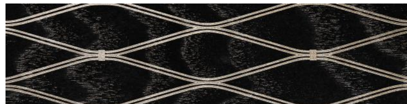
Bois véritable frêne noir avec incrustation G-Matrix