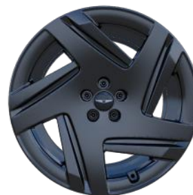
ROUES 21" NOIR MAT – FINITION USINÉE