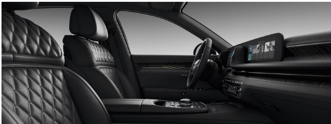
Noir Obsidienne Monochrome