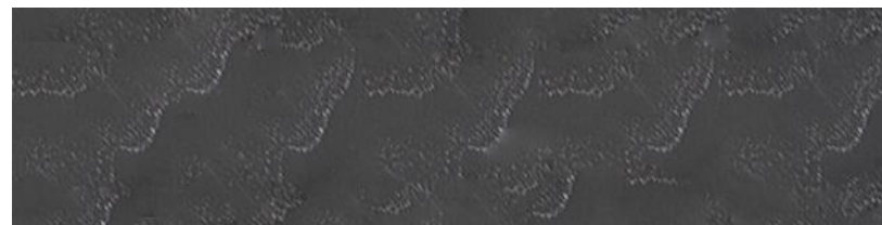
Bois véritable de frêne noir