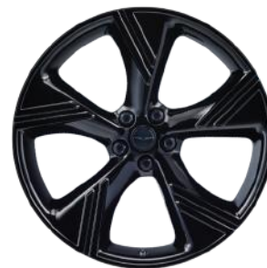
ROUES 22" FINITION NOIR BRILLANT