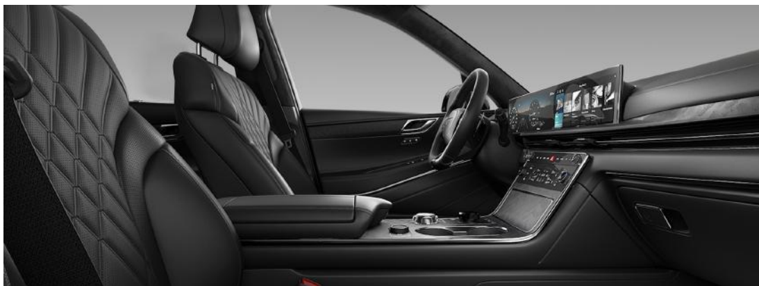
Noir Obsidienne monochrome