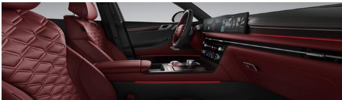
Noir obsidienne / Rouge Seville deux tons