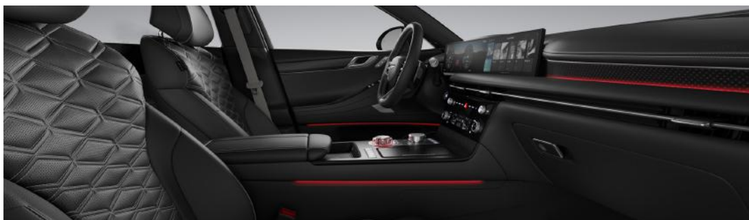
Noir obsidienne monochrome avec coutures grises