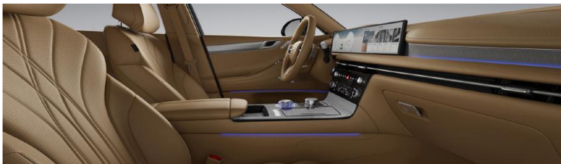
Écru chameau monochrome