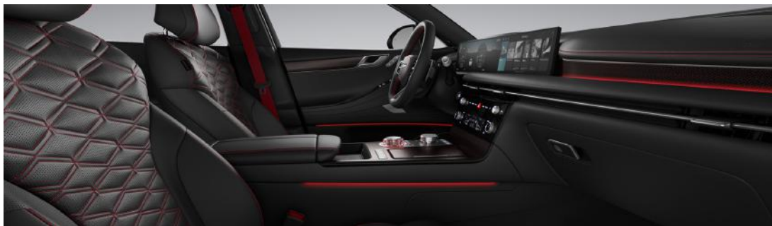
Noir obsidienne monochrome avec surpiqûres rouges