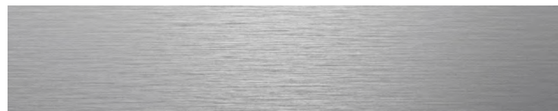
Garnitures en aluminium