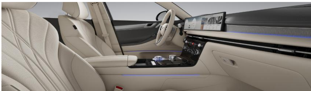
Beige vanille / Vert fumé deux tons