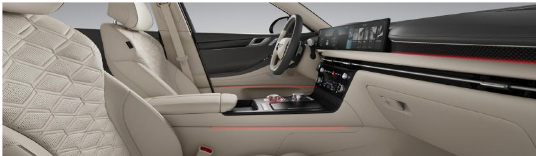
Beige vanille / Vert fumé deux tons