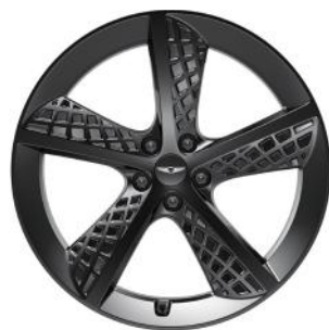
JANTES GRIS MOYEN PULVÉRISÉES DE 20 PO