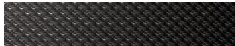
Finition en fil d'argent carbone