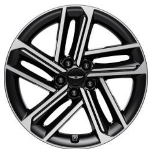
JANTES ARGENT HYPER DE 19 PO