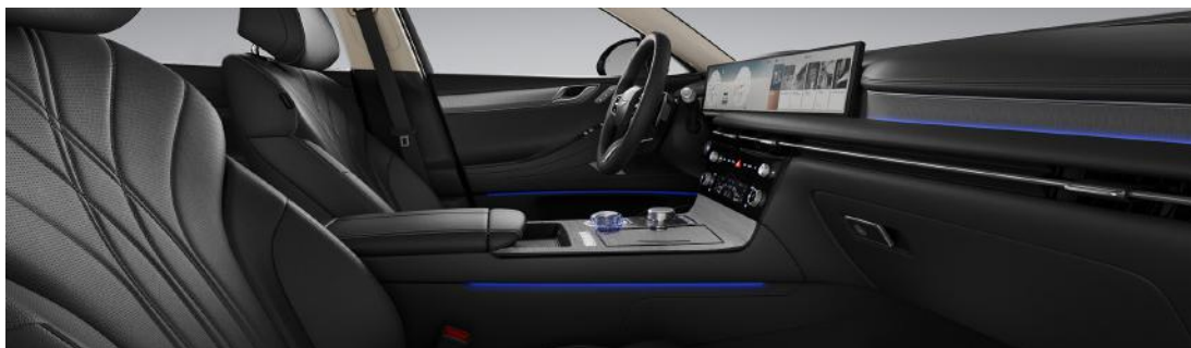
Noir obsidienne monochrome