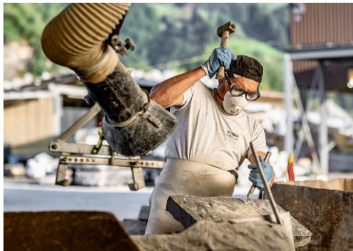
Seit 1903 wird der Guber-Quarzsandstein ob Alpnach abgebaut und im Steinbruch der Alpnacher Firma verarbeitet.

vor allem in der eigentlichen Steinverarbeitung. «Bei uns arbeiten seit mindestens 40 Jahren Portugiesen, oftmals sehr langjährige Mitarbeiter. Pensionierungen solcher Leute stellen uns jeweils vor grosse Herausforderungen», so Kluser. Er spricht von sympathischen, arbeitswilligen und zuverlässigen Arbeitskräften, die ihren Beruf mit Stolz ausüben.