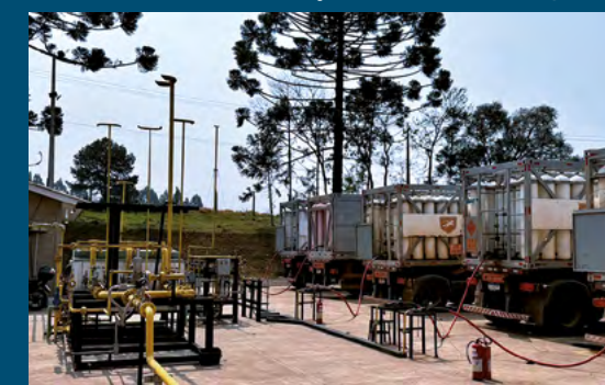
Campo de Barra Bonita - Pitanga - PR