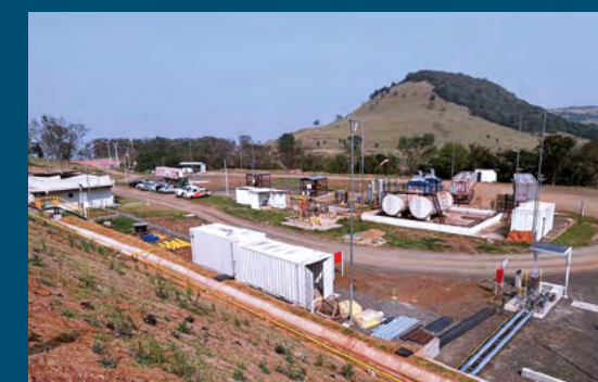
Poço Barra Bonita - Pitanga - PR