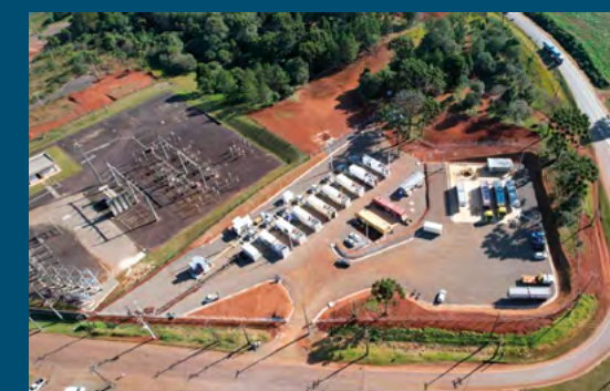
UTE Barra Bonita - Pitanga - PR

Identificamos oportunidades para avaliar e desenvolver campos maduros e marginais, ajudando-os a atingir seus níveis ideais de produção.