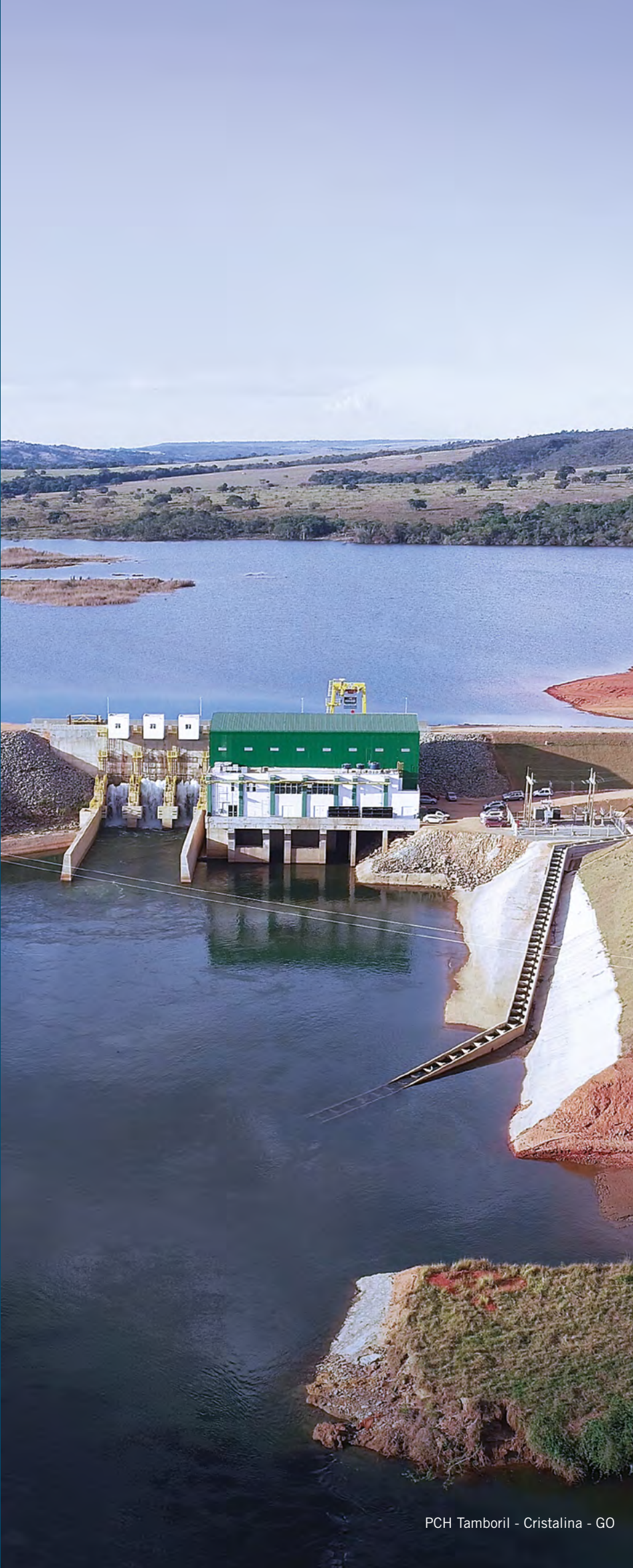
PCH Tamboril - Cristalina - GO