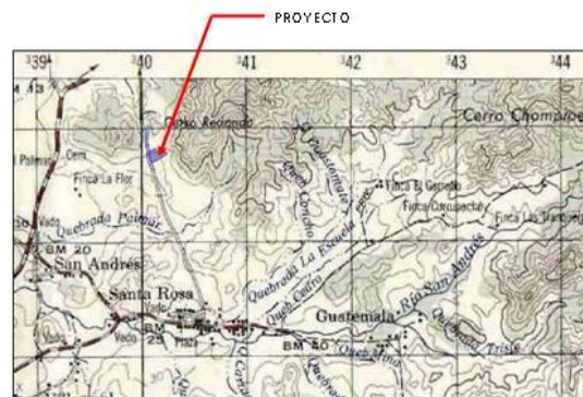
Figura 1: Ubicación del Proyecto

El Proyecto Zen Condominium Tamarindo, en adelante referido el Proyecto o Zen Condominium, eras un proyecto residencial, a ser desarrollado bajo la figura de condominio, y ubicado en Santa Rosa, distrito Veintisiete de Abril, cantón Santa Cruz, provincia Guanacaste, coordenadas aproximadas 340 200 E/ 256 800 N, de la hoja cartográfica Villareal 1:50.000 del Instituto Geográfico Nacional, tal y como lo muestra la Figura 1.