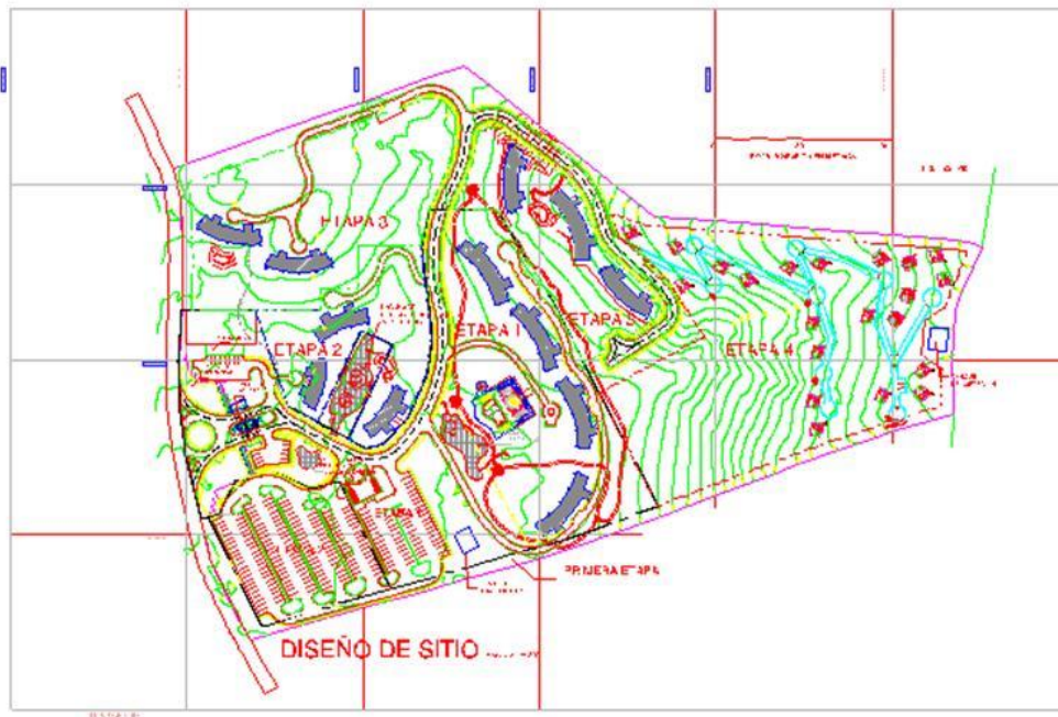
Figura 3: Plano de Conjunto

Nota: Plano de Conjunto sujeto a cambios con respecto planos finales presentados a instituciones estatales