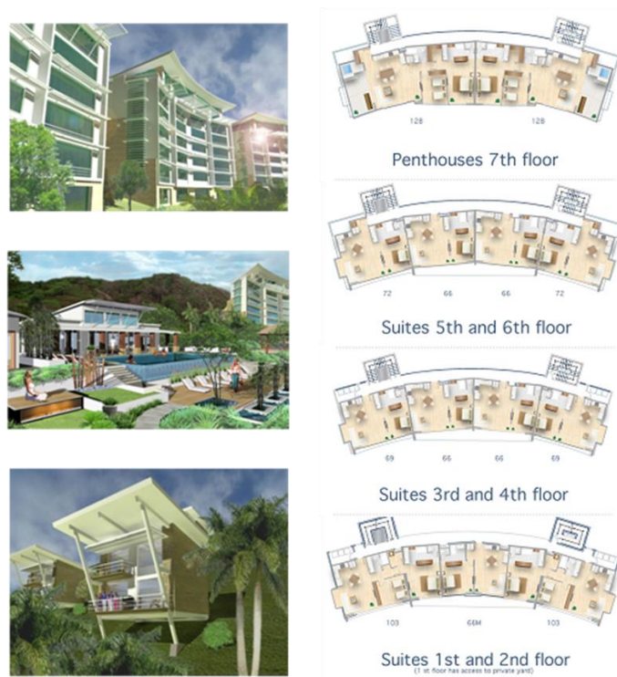
Figura 5: Arquitectura & Distribuciones Internas

Nota: Figura de carácter ilustrativo, sujeto a cambio.