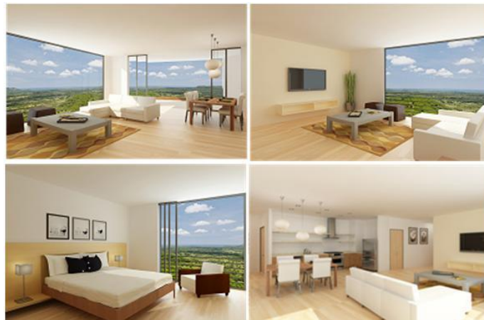
Figura 7: Perspectivas Indicativas de Interiores

Nota: Figura de carácter ilustrativo, sujeto a cambio.