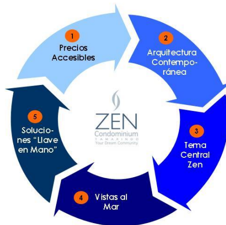
Figura 4: Elementos Diferenciadores del Proyecto

El Proyecto busca establecerse en el mercado residencial mediante la combinación de cinco elementos. El diseño final y las características eventuales de los edificios residenciales del Proyecto dependen de las condiciones del mercado residencial.