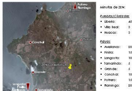
Figura 2: Distancia de Puntos Clave

El Proyecto está localizado a 20 minutos de un número de playas de importancia turística del Pacífico Norte de Guanacaste, como lo son Playa Tamarindo, Grande, Flamingo, Conchal, entre otras. La Figura 2 muestra las distancias estimadas por vía terrestre – en minutos – de los principales puntos, incluyendo el Aeropuerto Internacional Daniel Oduber que se encuentra aproximadamente a 45 minutos del Proyecto.