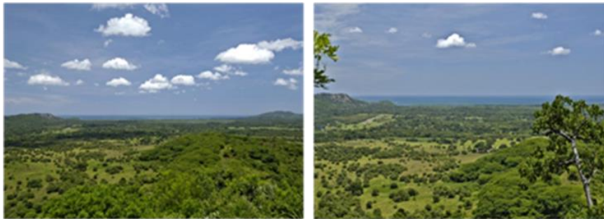
Figura 6: Vista al Mar desde Propiedad