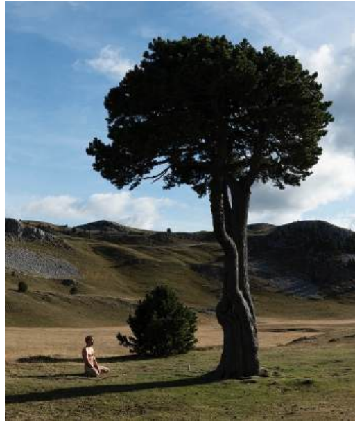
Être là, 2024