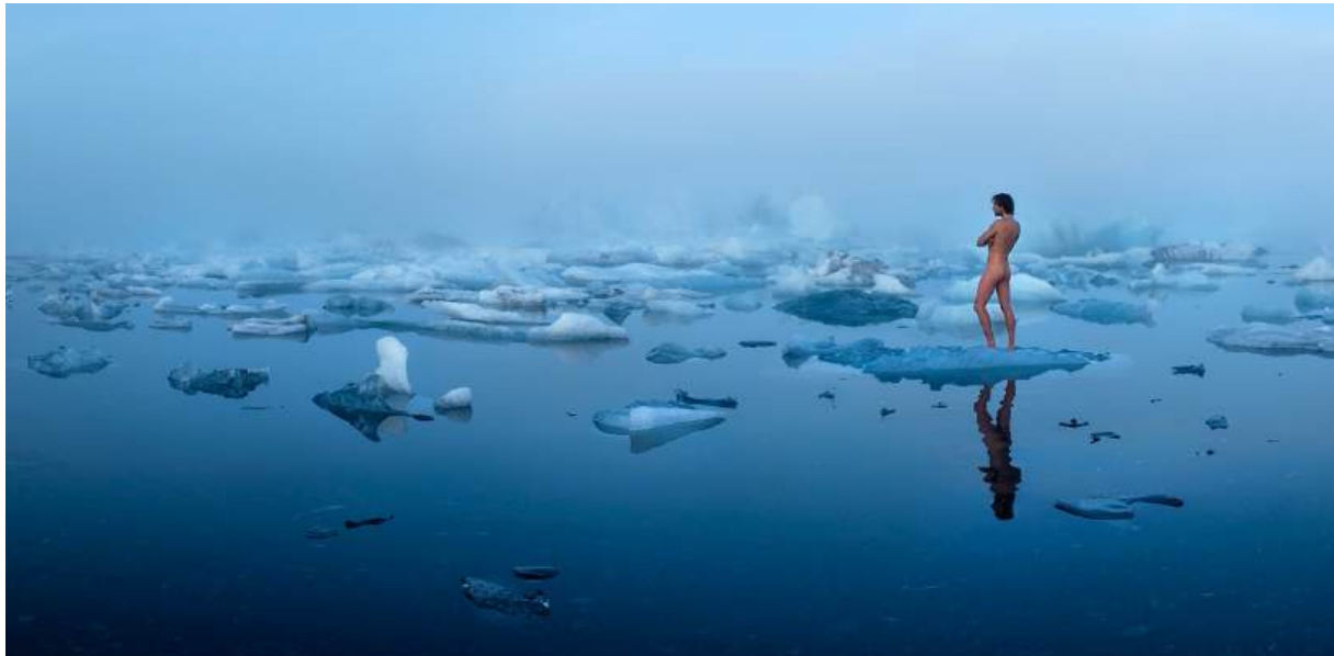
J'ai vogué sur un iceberg, 2015