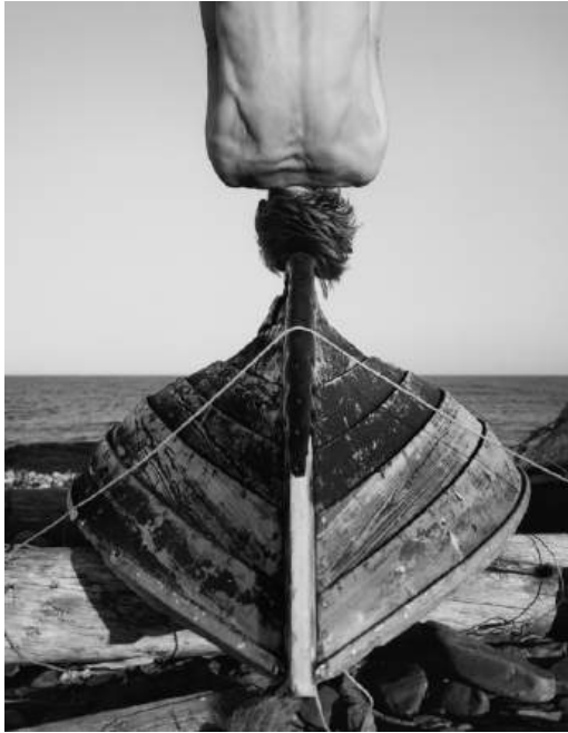
Kilberg, Vardø, Norvège, 1990