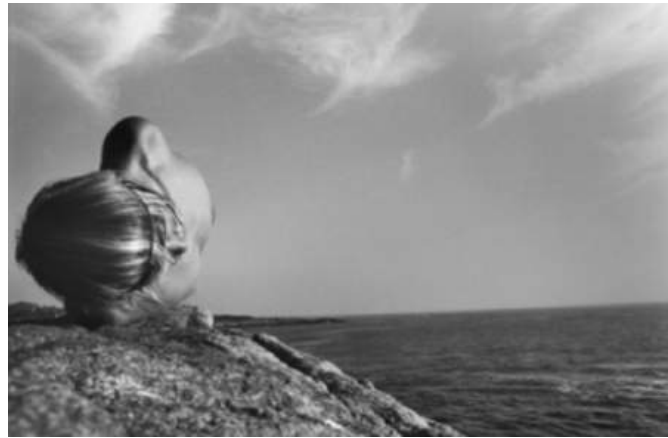
Narragansett Cliff, 1973

Mes premières photos prises en Finlande, à Nauvo, m'ont confirmé le caractère sacré de la nudité. Cette nudité essentielle qui imprègne toute la nature nous entoure aussi. En Finlande, où la nature peut se révéler dans toute sa splendeur, être nu et seul dans la forêt ou sur un rivage offre peut-être l'expérience la plus proche de la création. J'adore enfoncez mes orteils dans le sol forestier ou me promener pieds nus et fesses à l'air sur les rochers au bord du lac, tel un singe au paradis.