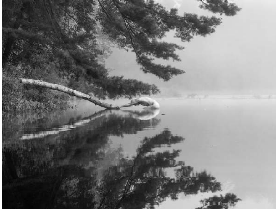
Swan Song, Fosters Pond, 2025