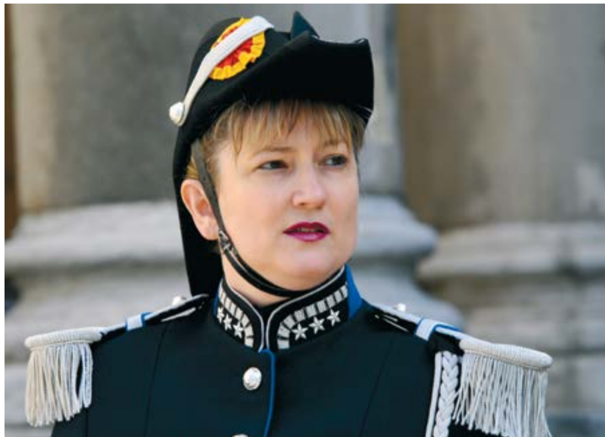
▲ Monica Bonfanti, commandante de la Police cantonale de Genève.

Les organisateurs de manifestations, tout comme les acteurs économiques (commerces, restaurants, hôtels), restent responsables des mesures de sécurité propres à leur activité ou à leurs installations. En cas de dommages matériels,