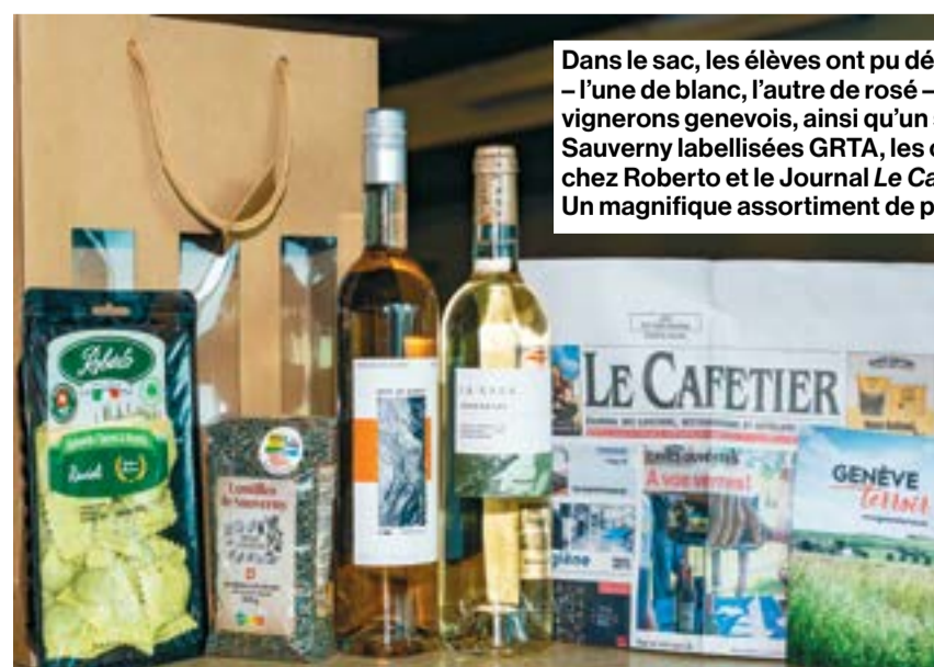
Dans le sac, les élèves ont pu découvrir deux bouteilles – l'une de blanc, l'autre de rosé – signées par des vigneron genevois, ainsi qu'un sachet de lentilles de Sauvigny labellisées GRTA, les célèbres raviolis de chez Roberto et le Journal Le Cafetier . Un magnifique assortiment de produits du terroir local!