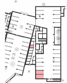
TIEFGARAGENSTELLPLATZ UND KELLERABTEIL M 1:1000