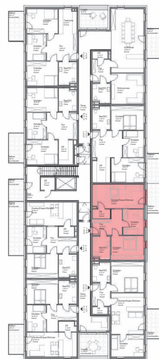
GRUNDRISS OG1 M 1:500