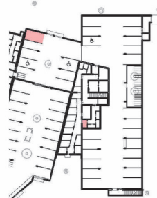
TIEFGARAGENSTELLPLATZ UND GEMEINSCHAFTS- KELLER M 1:1000