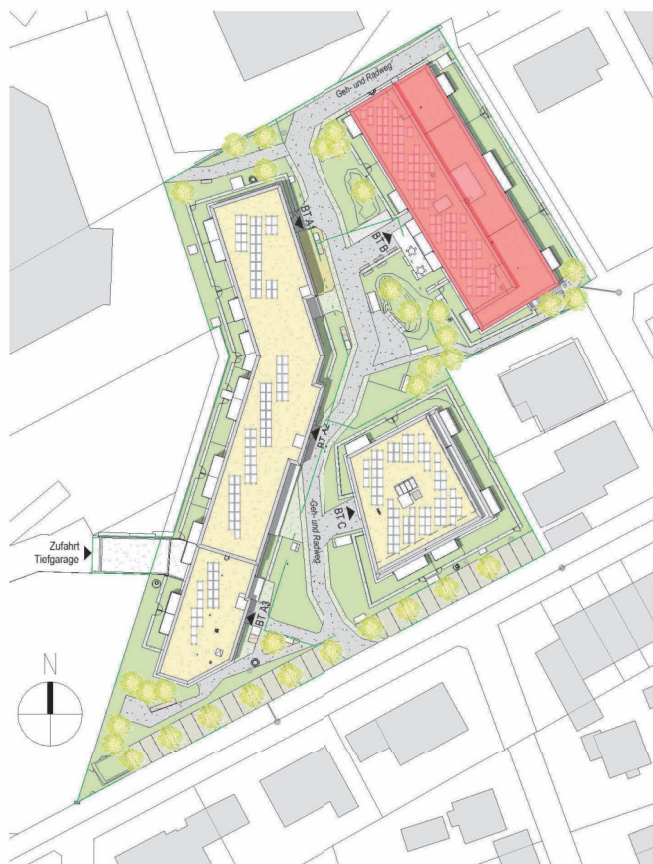
LAGEPLAN M 1:1000