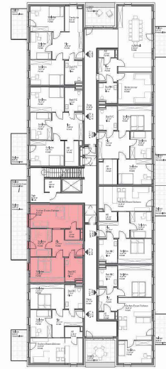
GRUNDRISS OG1 M 1:500