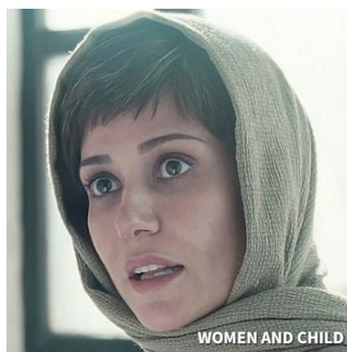
WOMEN AND CHILD