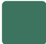
Patinagrün RAL 6000