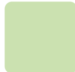
Weißgrün RAL 6019