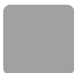
Weißaluminium RAL 9006