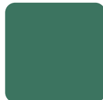
Patinagrün RAL 6000