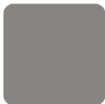
Graualuminium RAL 9007