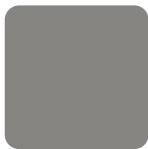
Graualuminium RAL 9007