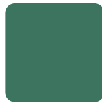
Patinagrün RAL 6000