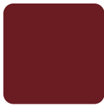
Purpurrot RAL 3004