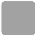
Weißaluminium RAL 9006