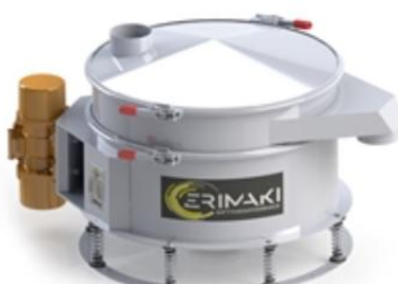
Direktutkast sikt med 1 motor