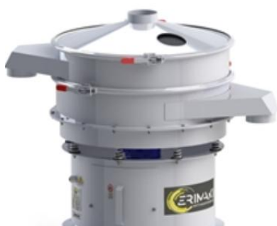
Cirkulärt vibrerande sikt.