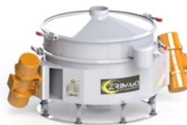
Direktutkast sikt med 2 motorer