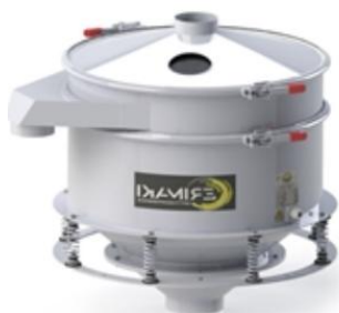
Direktutkast med central motor