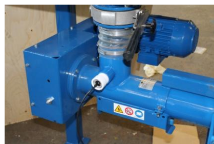
Kapacitiv givare i skruvinlopp