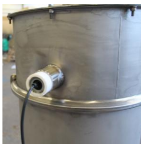
Kapacitiv givare i behållare – överfyllnadsödd.