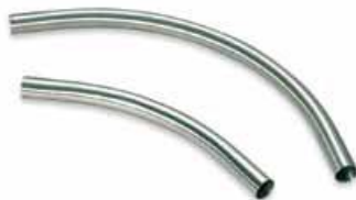
Rörböjar i rostfritt stål

Rör har lägre friktion - snabbare och smidigare transport - än slangar och bör användas i alla stationära installationer. Den totala transportsträckan, det vertikala avståndet, antalet rörböjar, diametern, om stålrör ska användas, vakuumslangar eller en kombination av rör och slangar, typ av anslutningar mellan rören - dessa är alla faktorer som ska tas i åtanke när ett rörledningssystem ska väljas.